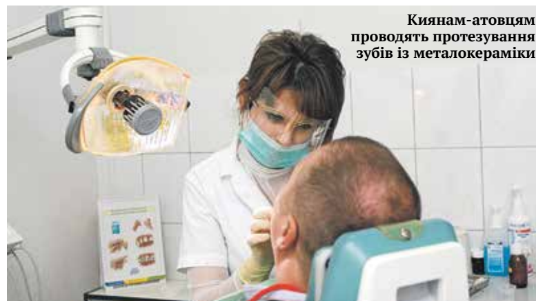
Киянам-атовцям проводять протезування зубів із металокераміки

– Насправді, нині люди досі часто недооцінюють важливість вчасної психологічної допомоги. Мабуть, тому, що в Україні дотепер не розвинена культура звернення до таких спеціалістів. Хоча у багатьох випадках саме цей фактор відіграє ключову роль в ефективному відновленні здоров'я ветеранів.