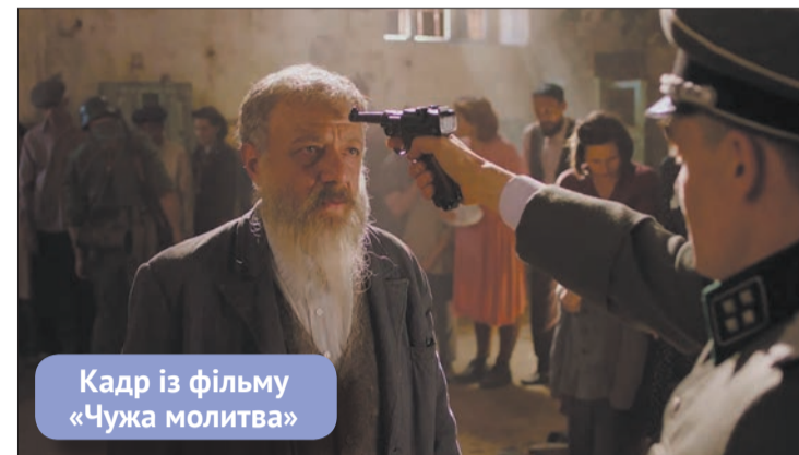
Кадр із фільму «Чужа молитва»

Кінострічкою «Чужа молитва» режисера Ахтема Сеїтаблаєва у столиці Словачької Республіки відкрили культурно-просвітницький захід «Дні Києва у Братиславі».