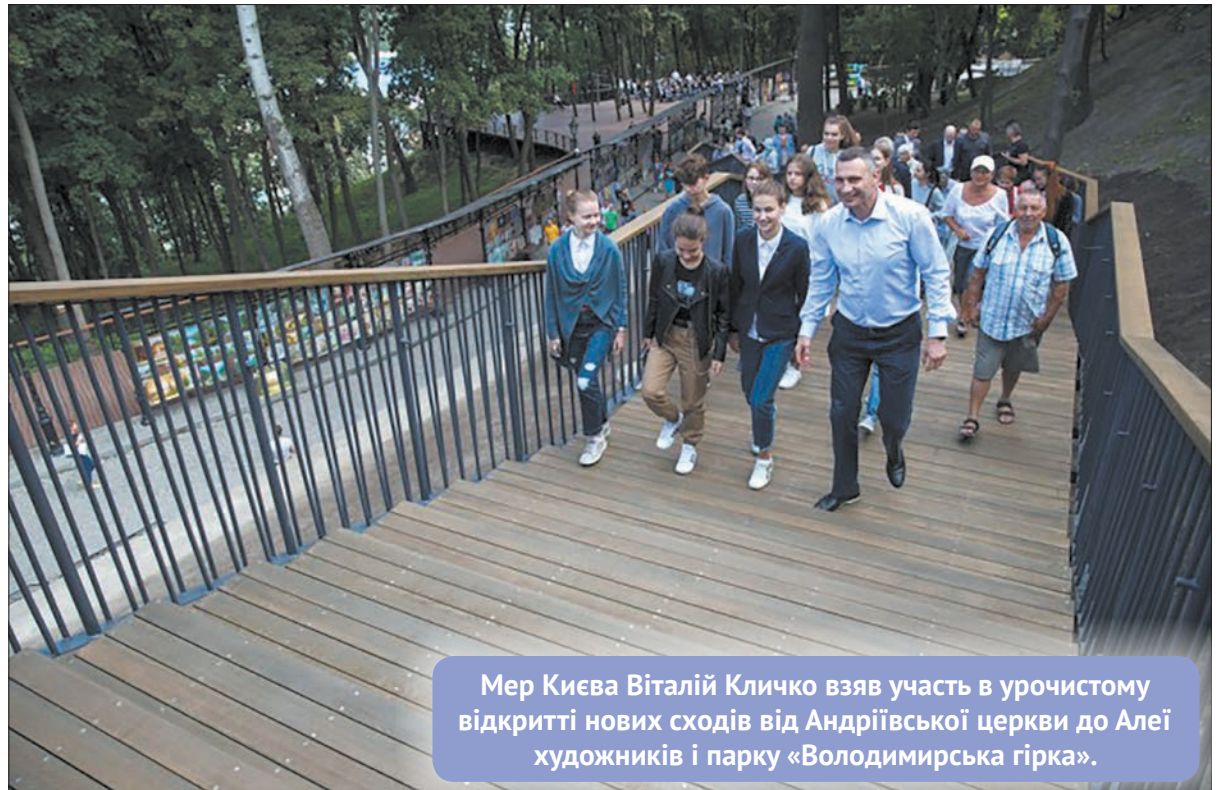
Мер Києва Віталій Кличко взяв участь в урочистому відкритті нових сходів від Андріївської церкви до Алеї художників і парку «Володимирська гірка».

Нові сходи зведені за тим же принципом, що і сходи, які відкрили минулого року від Пейзажної Алеї в урочище Кожум'яки. Це збірна залізобетонна конструкція з дерев'яними сходишками.