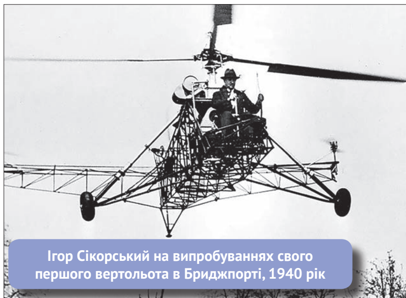
Ігор Сікорський на випробуваннях свого першого вертольота в Бриджпорті, 1940 рік

«Може, після відкриття пам'ятника, справа із садибою Сікорських зрушить таки з мертвої точки. І люди зможуть побачити, де ріс і творив видатний авіаконструктор. Це – наша історія, яку ми маємо берегти і ділитися нею зі світом. Адже Україні є чим і ким пишатися! І ми повинні це робити!», – підкреслив Віталій Кличко ■