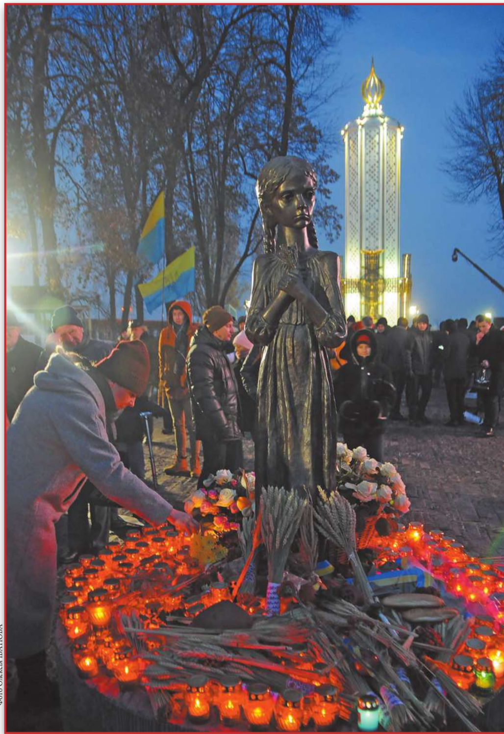
У суботу в столиці на території Національного музею «Меморіал жертв Голодомору» відбулись жалобні заходи до роковин Голодомору 1932-1933 років

«Усі покоління українців повинні пам'ятати про страшну трагедію Голодомору. Мільйони наших співвітчизників були вбиті. Так, саме вбиті тодішньою радянською владою. Людей свідомо нищили, намагаючись викоринити