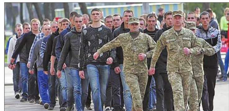
Підготував Віталій ЗНАМЕНСЬКИЙ | «Хрещатик»

«Насправді ж затримати громадянина може лише Національна поліція і лише за якимсь правопорушенням. Силою ми нікого не примуємо з'явитись на призовний пункт. Тож ми сподіваємось на свідомість киян», – запевнив полковник ■