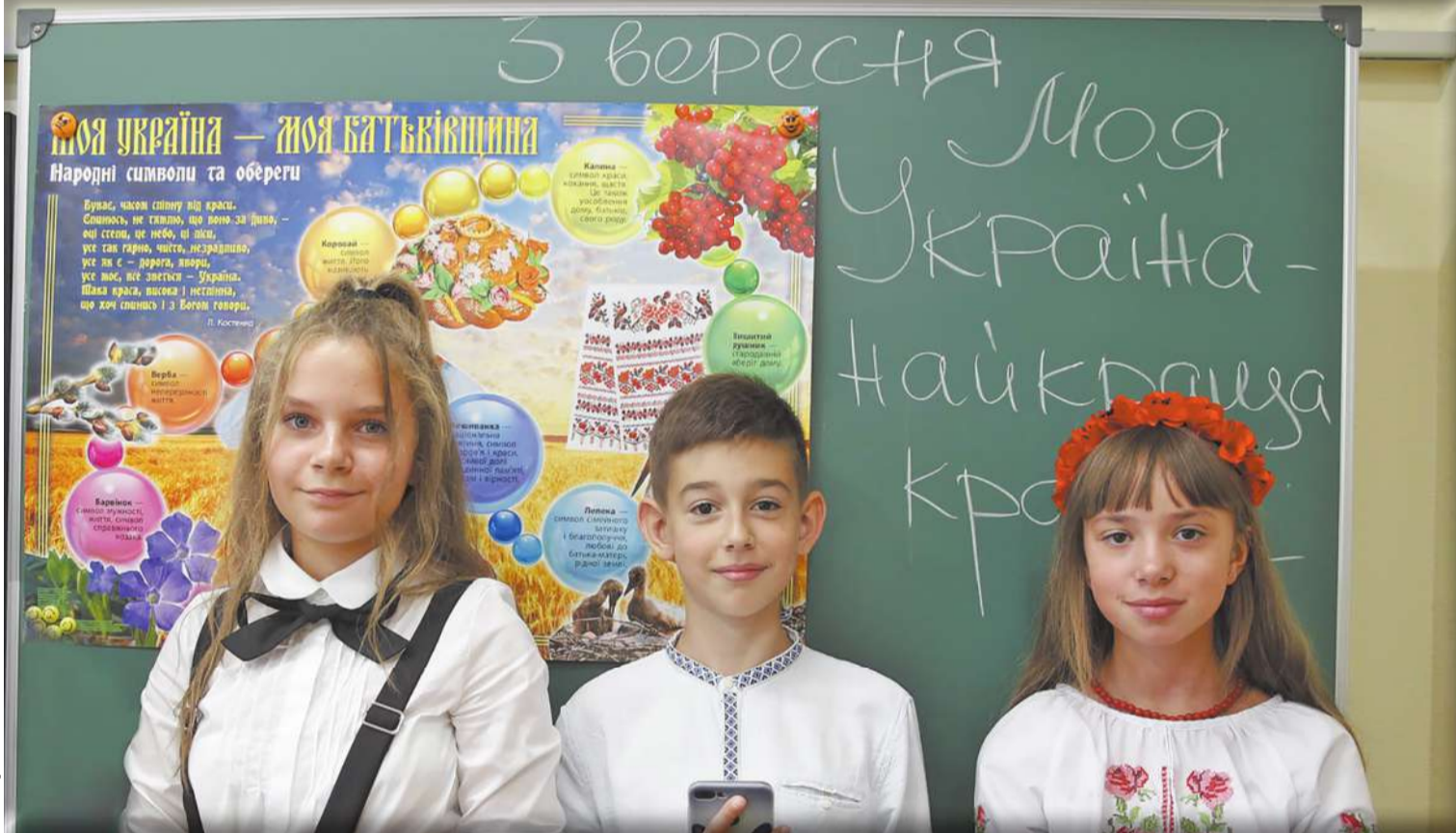
Учора в Дарницькому районі столиці відбулося урочисте відкриття найсучаснішої школи в Україні. Під час святкової лінійки мер Києва Віталій Кличко вручив символічний ключ керівникам початкової школи та ліцею «Інтелект». А для першокласників цього дня пролунав традиційний перший дзвінок

Учора Київський міський голова Віталій Кличко відкрив нову найсучаснішу школу в Україні – школу № 334 у Дарницькому районі та привітав дітей і вчителів із початком навчального року. У новому освітньому закладі буде розміщена початкова школа та ліцей «Інтелект». Тут зможуть навчатися близько 1,5 тисячі дітей. Для них є все необхідне обладнання та техніка, аби учні навчалися комфортно та здобували освіту європейського рівня.