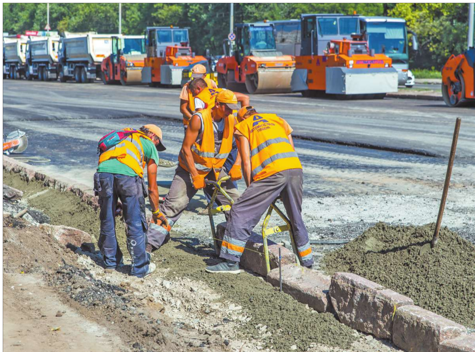
Капітально відремонтовану вулицю Заболотного здадуть в експлуатацію в травні наступного року, але основні роботи мають завершити цьогоріч

■ Триває масштабне оновлення столичних магістралей. Перелік капітально відремонтованих шляхів незабаром поповнить вулиця Заболотного