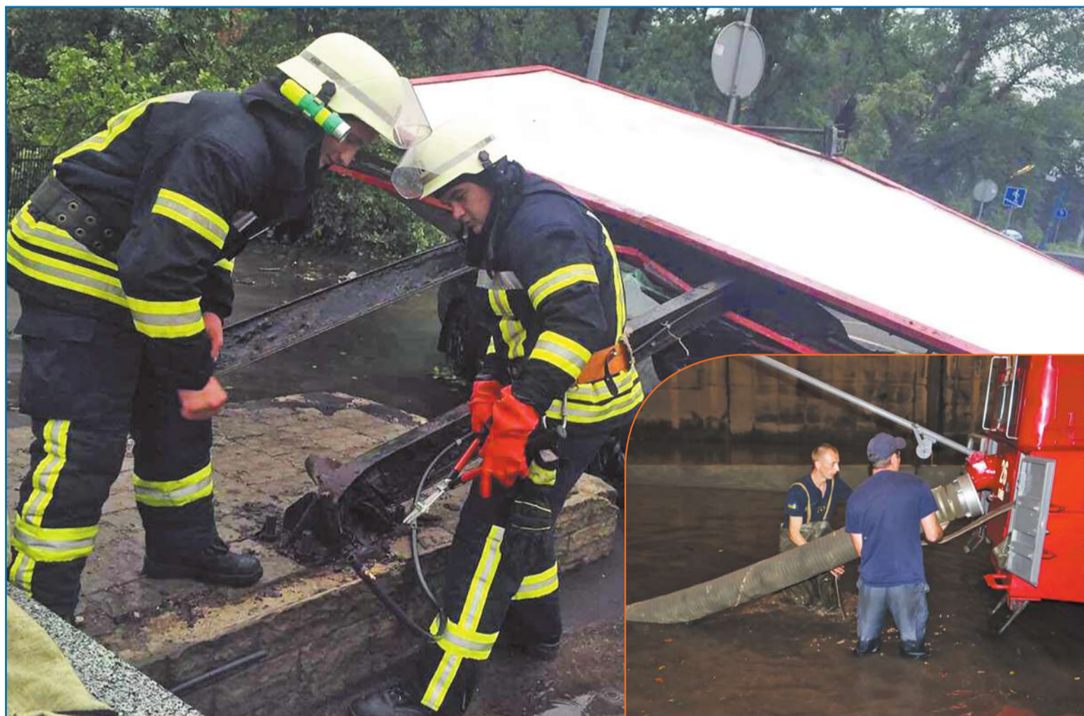
У першу чергу, наслідків негоди в столиці зазнали дороги і переходи, що розташовані у низинах

Аномальна кількість опадів і неспроможність старої ливневої каналізації впоратись із примхами стихії стали справжнім іспитом для комунальних служб міста