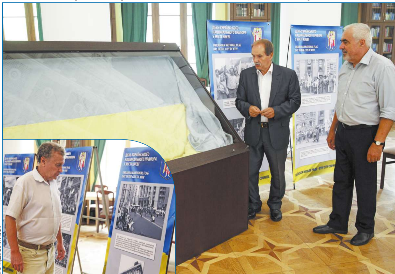
В рамках святкування Дня українського національного прапора в Києві учора в мерії підготували фотовиставку подій 28-річної давнини, представили історичний стяг, який 24 липня 1990-го замайорів над столицею

28 років тому у липневому небі столиці засяяв стяг, якому судилося стати історичною реліквією вільної і незалежної України