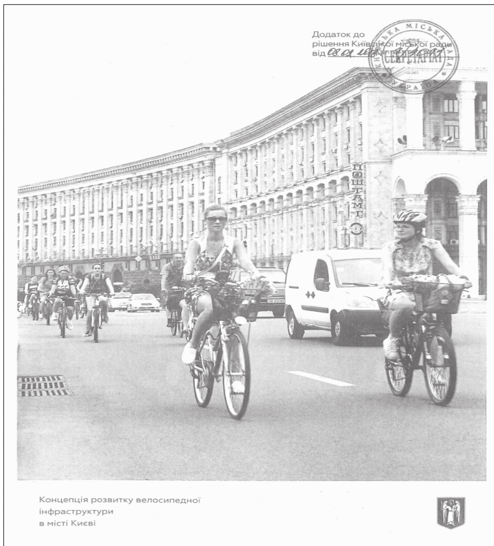
Концепція розвитку велосипедної інфраструктури в місті Києві