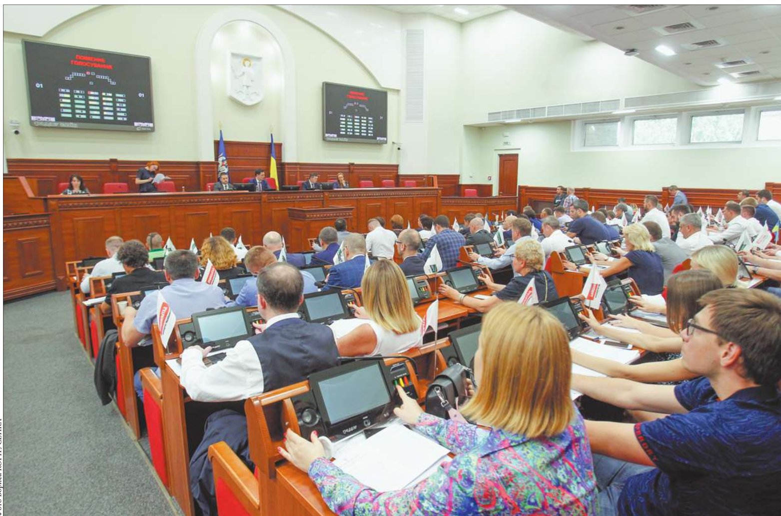
Під час учорашнього засідання Київради депутати розглянули низку важливих для міста питань життєдіяльності

Столичні депутати ухвалили низку рішень, які зроблять міське середовище комфортнішим і наблизять ДНЗ до євростандартів