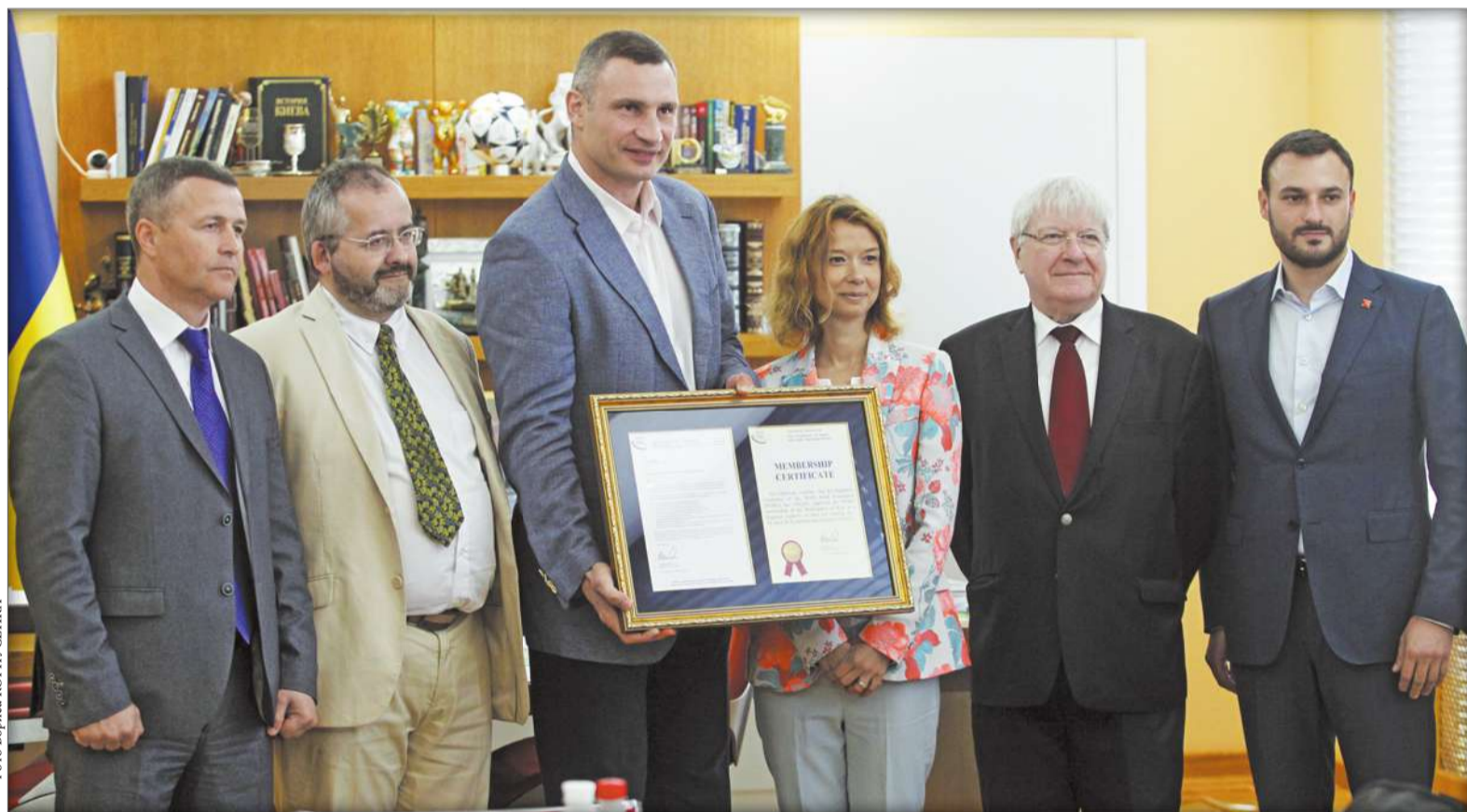
Учора сертифікат про набуття членства Світової асоціації автомобільних магістралей меру Києва Віталію Кличку передав заступник генсекретаря Асоціації Робін Себіль

Зроблено ще один важливий крок до оновлення й комфорту дорожньої інфраструктури столиці України. Учора сертифікат про набуття членства Світової асоціації автомобільних магістралей меру Києва Віталію Кличку передав заступник генсекретаря Асоціації Робін Себіль. Під час зустрічі сторони домовилися, що вже наприкінці жовтня у нашому місті відбудеться міжнародний семінар Світової асоціації автомагістралей.