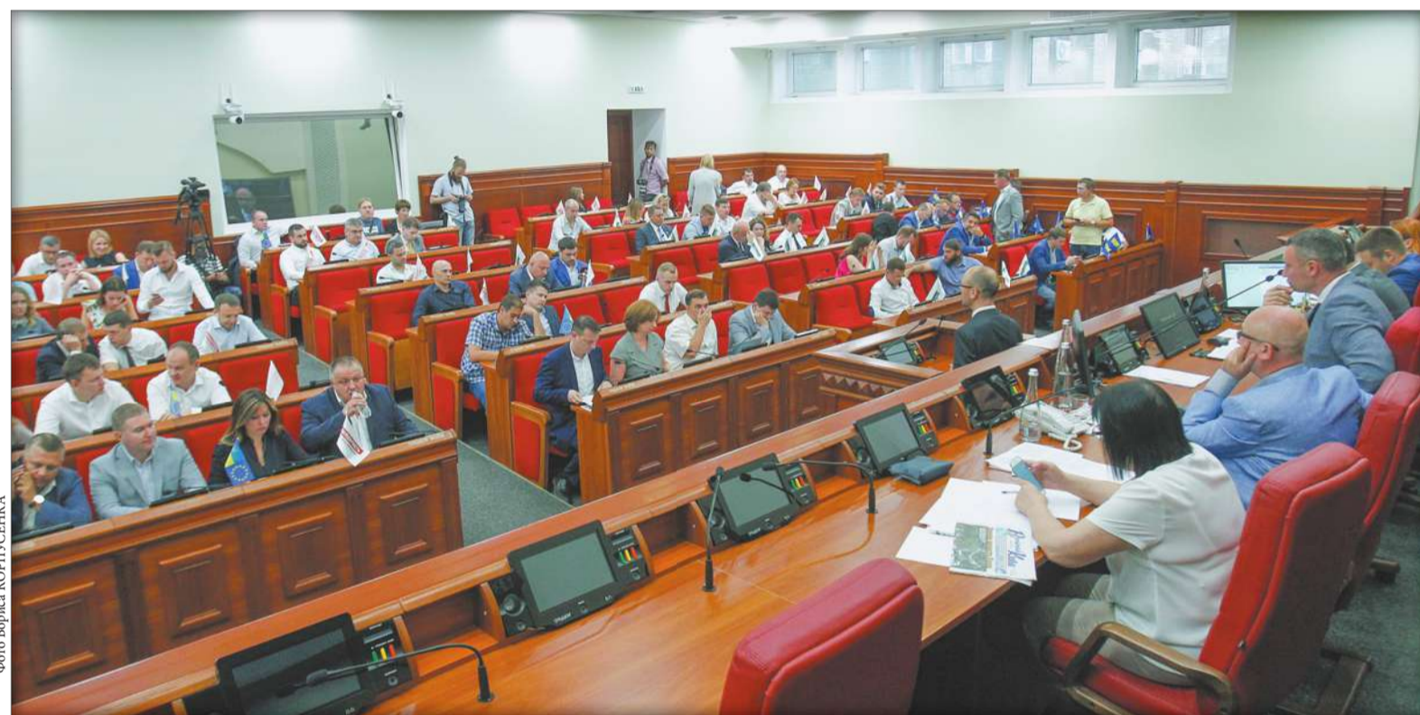
Учора депутати Київради 68 голосами прийняли рішення щодо збереження артефактів, знайдених під час розкопок на Поштової площі

Депутати Київради ухвалили рішення щодо збереження артефактів, знайдених на Поштової площі