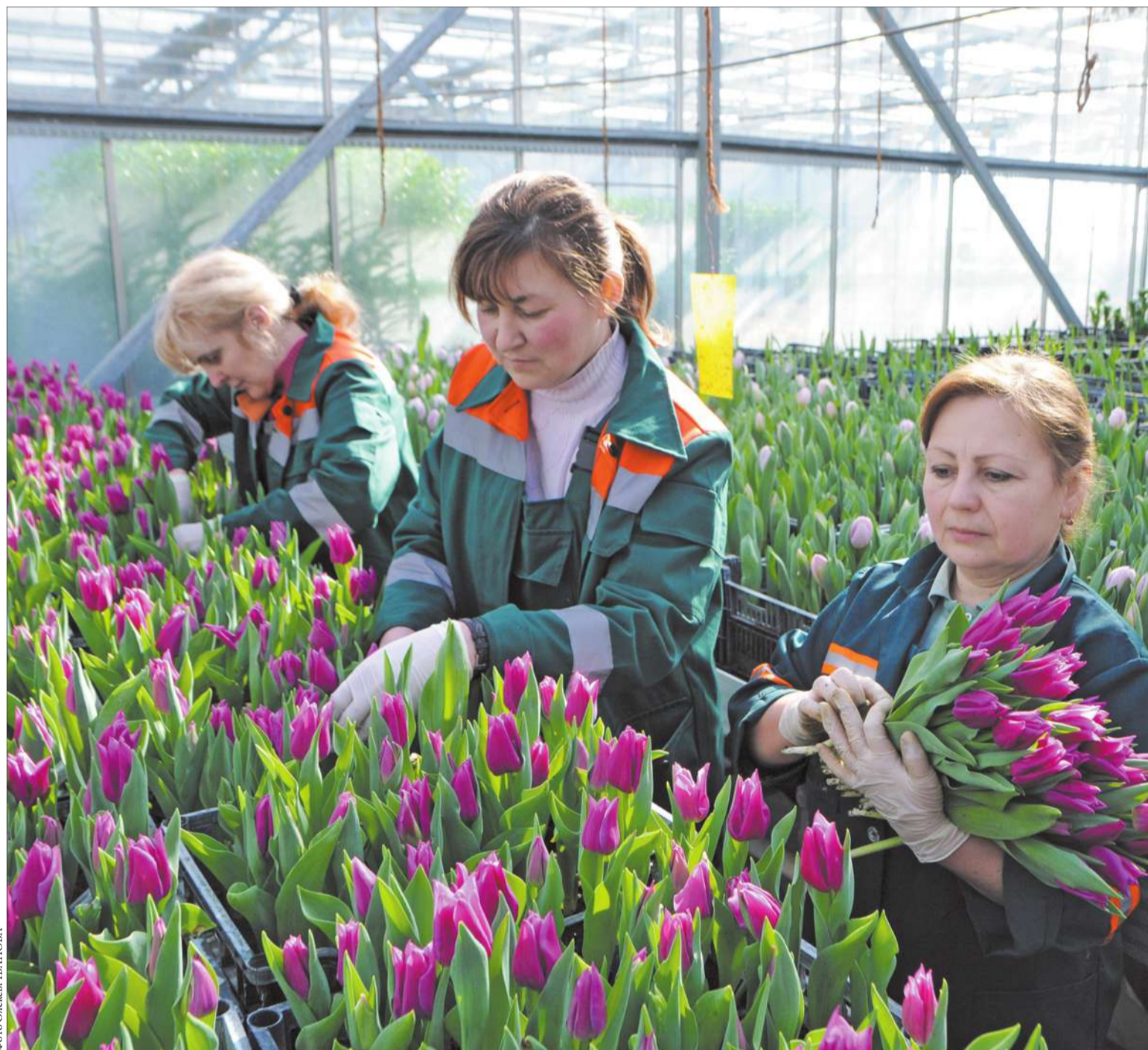
Нині в оранжерейному господарстві КО «Київзеленбуд» на Печерську зацвіло понад 70 тисяч тюльпанів

Напередодні Міжнародного жіночого дня комунальне об'єднання «Київзеленбуд» подарувало місту справжню весну