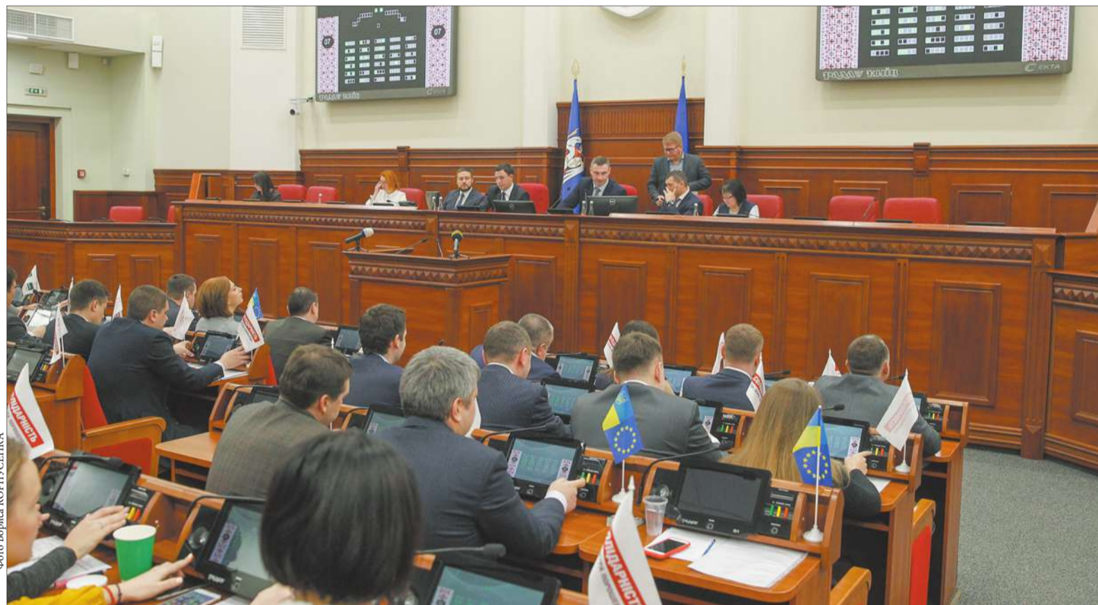
Учора на сесії Київради депутати внесли зміни до Регламенту Київради та до Порядку найменування міських об'єктів іменами фізичних осіб, ювілейних та святкових дат, назв і дат історичних подій у столиці

Минулого четверга на сесії Київради депутати розглянули низку важливих для життєдіяльності міста питань. Зокрема мова йшла про внесення змін до Регламенту Київради та до Порядку найменування міських об'єктів іменами фізичних осіб, ювілейних та святкових дат, назв і дат історичних подій у столиці. Також було прийнято рішення про створення ще одного комунального ДНЗ (ясла-садок) №179 у Святошинському районі.