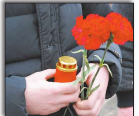
З нагоди Дня Героїв Небесної Сотні у столиці провели низку меморіальних заходів, присвячених пам'яті загиблих учасників Революції Гідності

У четвертий раз в нашій державі проходять акції, присвячені пам'яті тих, хто віддав свої життя під час подій Революції Гідності. 4 роки тому стався жорстокий розстріл 107 активістів у центрі столиці. У пам'ять про них було організовано низку меморіальних заходів на Алеї Героїв Небесної Сотні, на Майдані Незалежності, в інших місцях Києва.