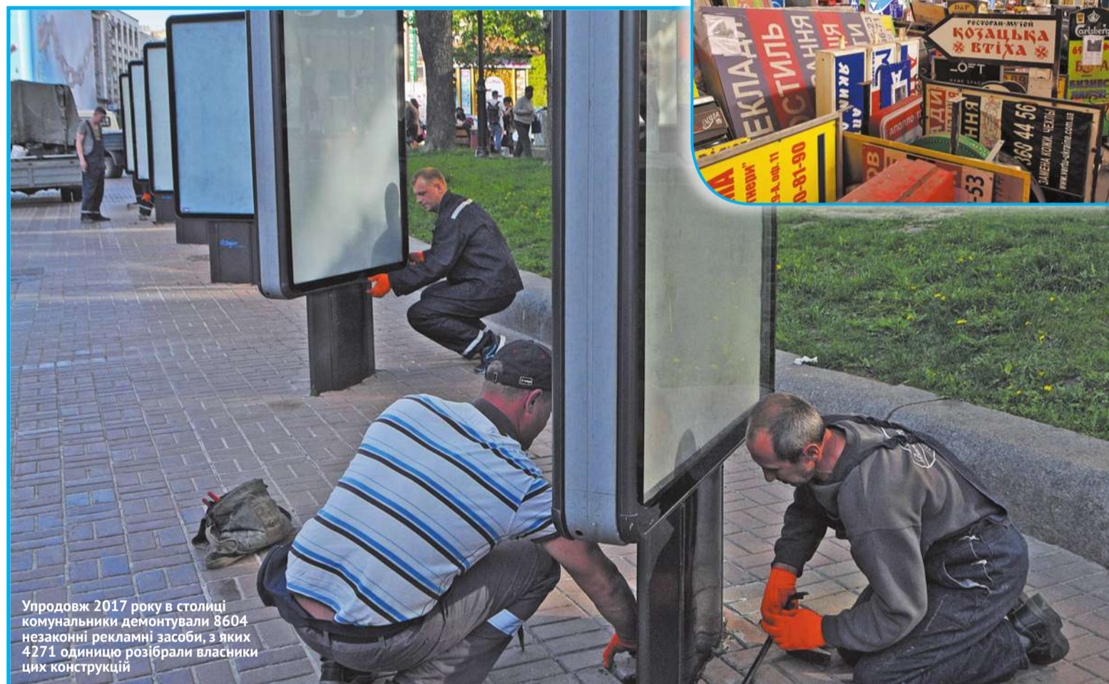
Упродовж 2017 року в столиці комунальники демонтували 8604 незаконні рекламні засоби, з яких 4271 одиницю розібрали власники цих конструкцій

■ Нова схема розміщення рекламних конструкцій сприятиме підвищенню безпеки та комфорту киян