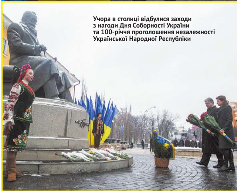
Учора в столиці відбулися заходи з нагоди Дня Соборності України та 100-річчя проголошення незалежності Української Народної Республіки

тована під час Революції, стала потужною матеріальною силою. Вона визначила увесь подальший перебіг історії України», – сказав Петро Порошенко під час відкриття виставки.