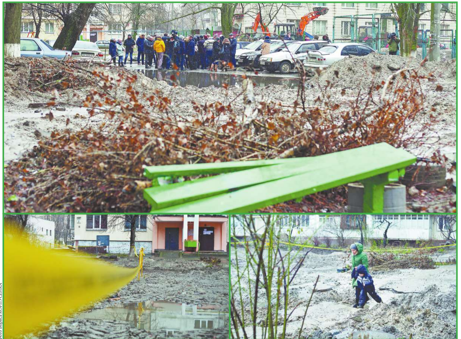
Київський міський голова Віталій Кличко доручив керівництву ПАТ «Київенерго» спільно з шляхово-експлуатаційними службами та районними «Зеленбудами» відновити благоустрій територій після проведення ремонтних робіт, поки це дозволяють погодні умови

Енергетики спільно з шляхово-експлуатаційними службами та районними зеленбудівцями мають відновити благоустрій територій, поки дозволяють погодні умови