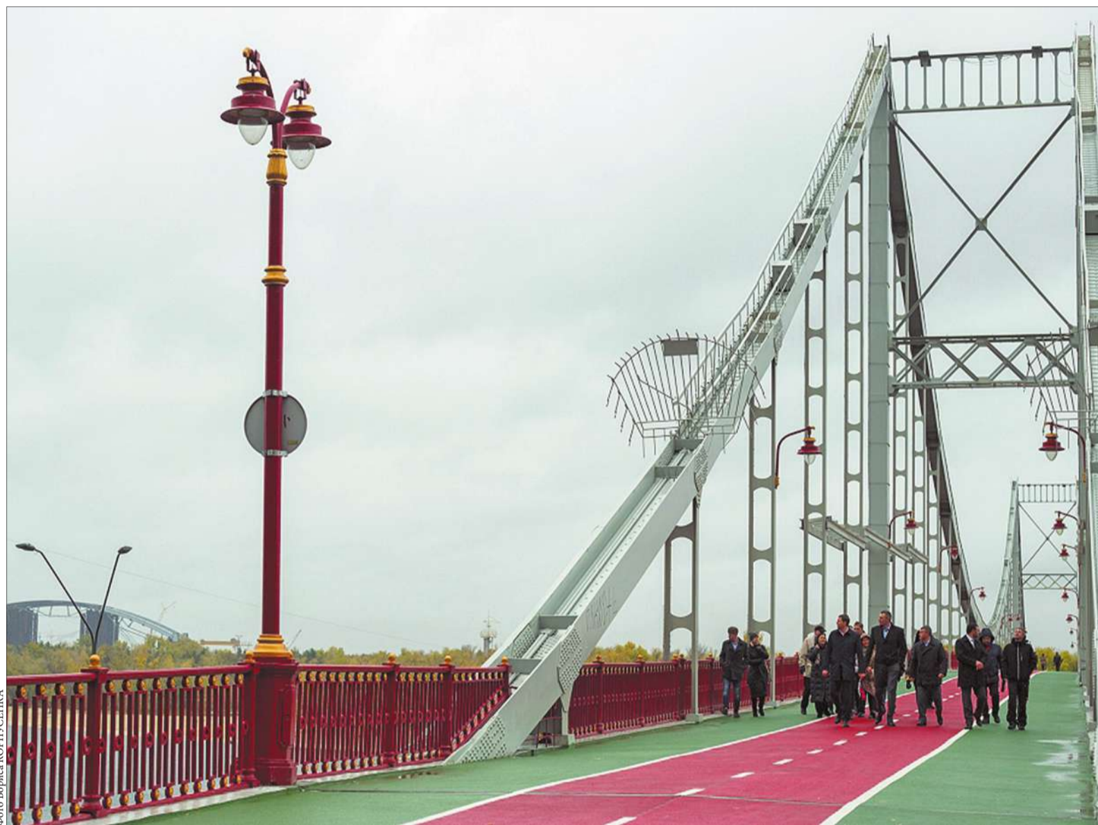
Серед об'єктів дорожньо-транспортної інфраструктури на яких нині завершуються ремонтні роботи – Пішохідний міст, який зв'язує правий берег столиці та Труханів острів

Комунальники завершують ремонтні роботи на мосту, який зв'язує правий берег столиці та Труханів острів