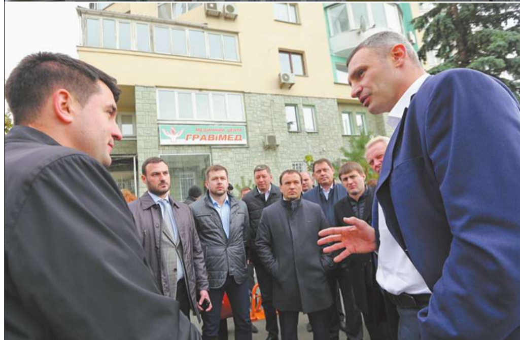
Днями у столиці відбулася інспекція житлового будинку на просп. Героїв Сталінграда, 12-д, де було запроваджено енергоефективні заходи за муніципальною програмою «70/30»

Запустити систему опалення для подачі тепла в будинки киян планують з понеділка, 16 жовтня. Про це мер столиці Віталій Кличко заявив під час інспекції житлового будинку на просп. Героїв Сталінграда, 12-д. Тут запроваджено енергоефективні заходи за муніципальною програмою «70/30». Завдяки цьому мешканці змогли зекономити за один місяць близько 30-40% на послугі централізованого опалення.