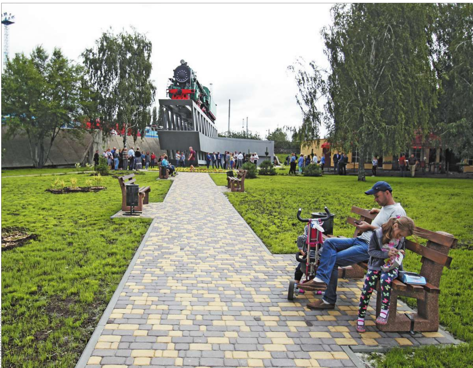
Учора після капітального ремонту в Солом'янському районі столиці відкрили сквер на площі Петра Кривоноса

У Солом'янському районі після реконструкції відкрили сквер «Площа Петра Кривоноса»