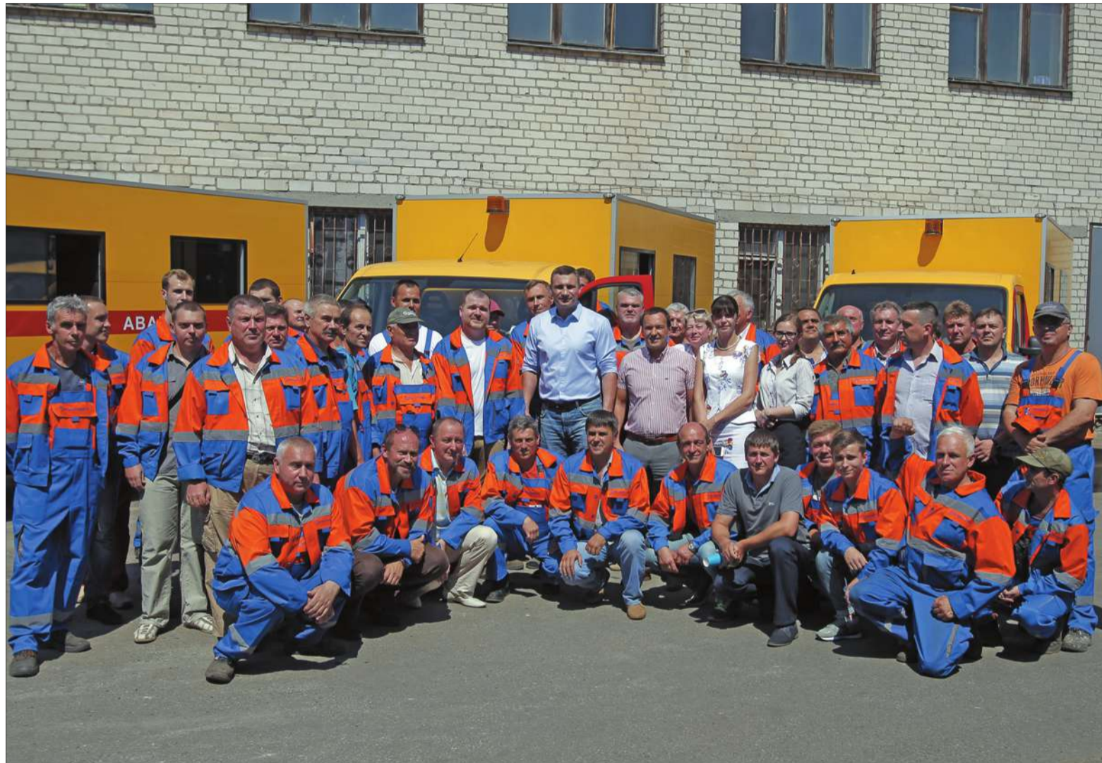
Сьогодні штат «Київтеплоенерго» налічує 211 осіб, і цього достатньо для ефективної роботи потужностей теплового господарства, яке обслуговує Дніпровський та Дарницький райони

Комунальне підприємство в перспективі забезпечуватиме стабільне теплостачання всім мешканцям