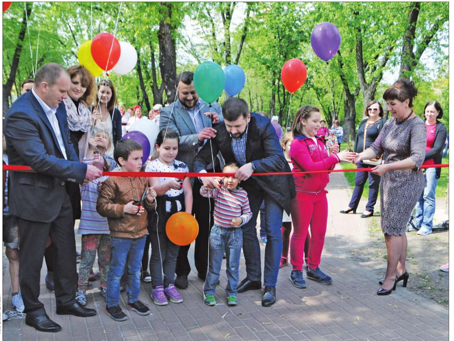
Учора в столиці після реконструкції відбулось урочисте відкриття оновленого парку відпочинку біля палацу культури «Дарниця»

Зусиллями комунальників на території парку облагороджено 250 кв. м доріжок із ФЕМ, 2 300 кв. м газону, дитячий і спортивний майданчики, створено 20 кв. м квітників, висаджено 18 хвойних дерев і 479 кущів. Окрім цього встановлено нові екологічні дерев'яні арт-об'єкти (вирізьблені скульптури різних тварин) та розвиваючі елементи для дітей, дошку для розвитку моторики пальців.