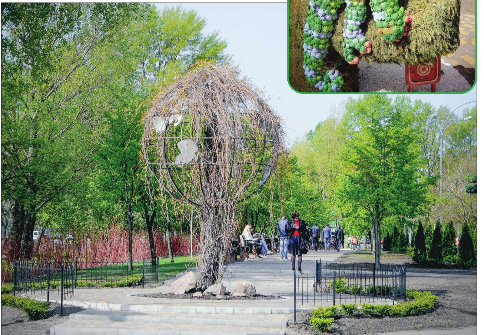
Після капремонту в сквері замінили доріжки, встановили металеву та «живу» огорожі, термочаші з ампельними квітами, сучасний напівавтоматичний полив, висадили різні види дерев та кущів, змонтували інсталяцію із шишок і ялівцю під назвою «Хамелеон»

У рамках підготовки до «Євробачення» столичні зеленбудівці оновили сквер та створили незвичайні арт-об'єкти