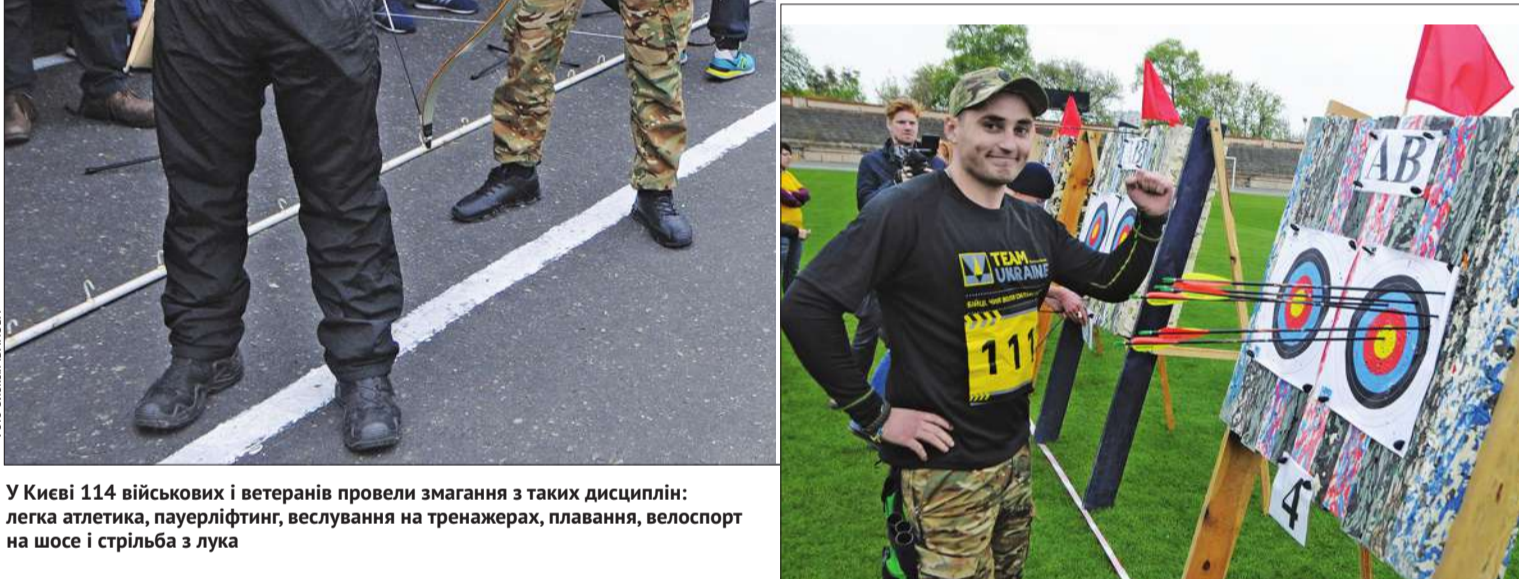
У Києві 114 військових і ветеранів провели змагання з таких дисциплін: легка атлетика, пауерліфтинг, веслування на тренажерах, плавання, велоспорт на шосе і стрільба з лука

22 та 23 квітня в Києві відбувся завершальний етап відбору до національної збірної, яка вперше восени цього року представлятиме Україну на Invictus Games в Торонто. Це міжнародні змагання для військовослужбовців та ветеранів, які зазнали травм або захворювань під час або внаслідок виконання службового обов'язку.