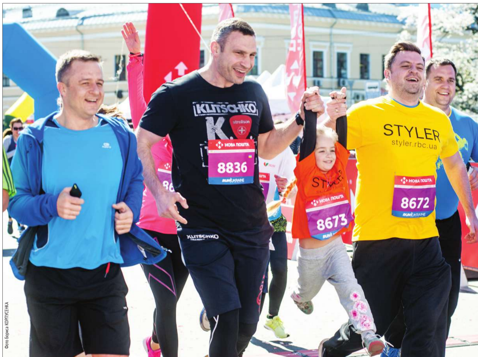
Мер столиці Віталій Кличко взяв участь у благодійному забігу Київського міжнародного півмарафону, який відбувся в місті в неділю

■ На столичних вулицях змагалися 9 тисяч бігунів із 48 країн світу