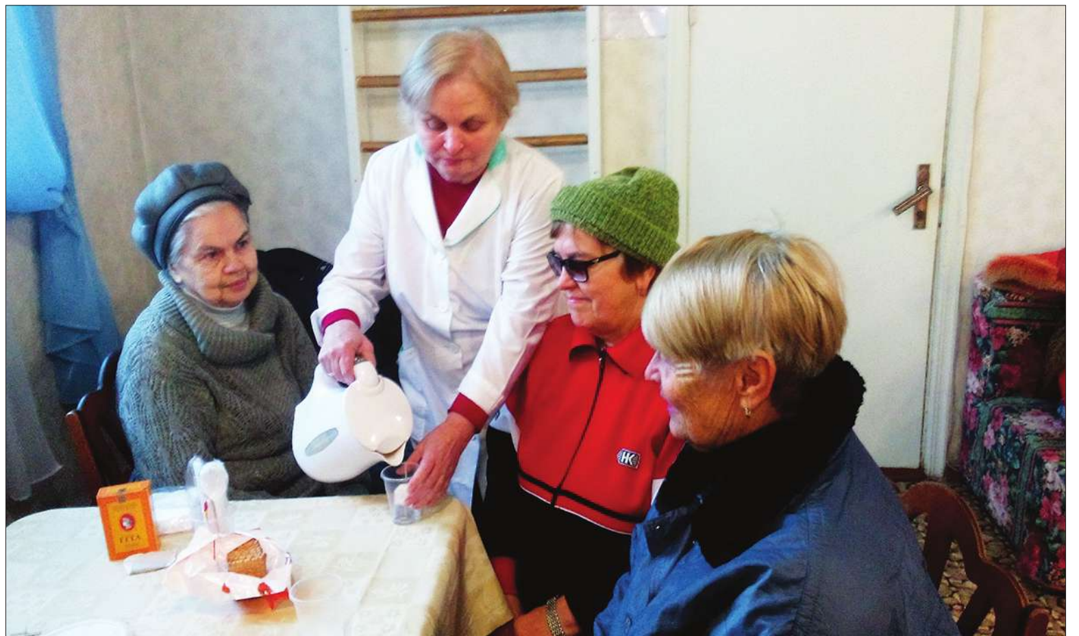
Під пункти обігріву цьогоріч в столиці обладнали переважно приміщення ЖЕКів, територіальних центрів соціального обслуговування, закладів охорони здоров'я. Тут люди можуть зігрітися, випити чаю чи кави

■ На час лютих холодів у Києві розгорнули 30 пунктів обігріву