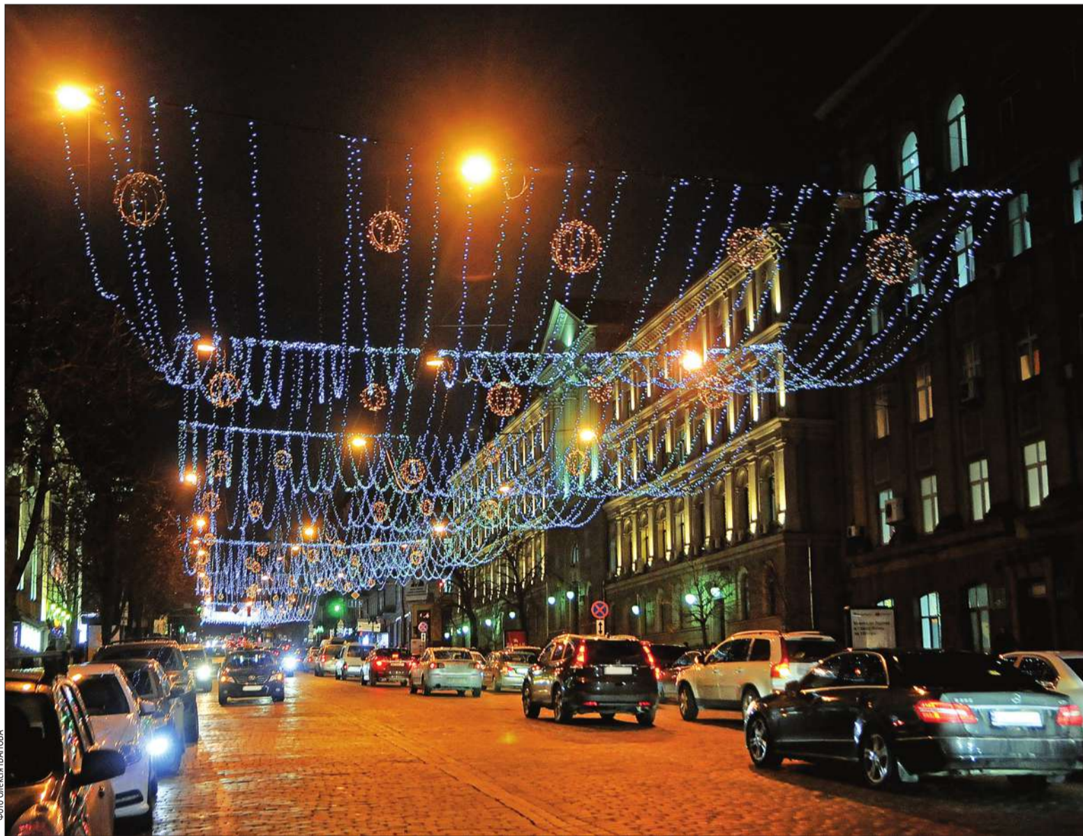
Наразі більше 3 000 гірлянд і 300 світлодіодних фігурних конструкцій прикрашають центральну частину столиці. Вулиця Богдана Хмельницького декорована ілюмінацією на тросових розтяжках над проїжджою частиною

До Нового року і Різдва в центрі Києва розвісили 3 000 гірлянд і встановили 300 світлодіодних фігурних конструкцій