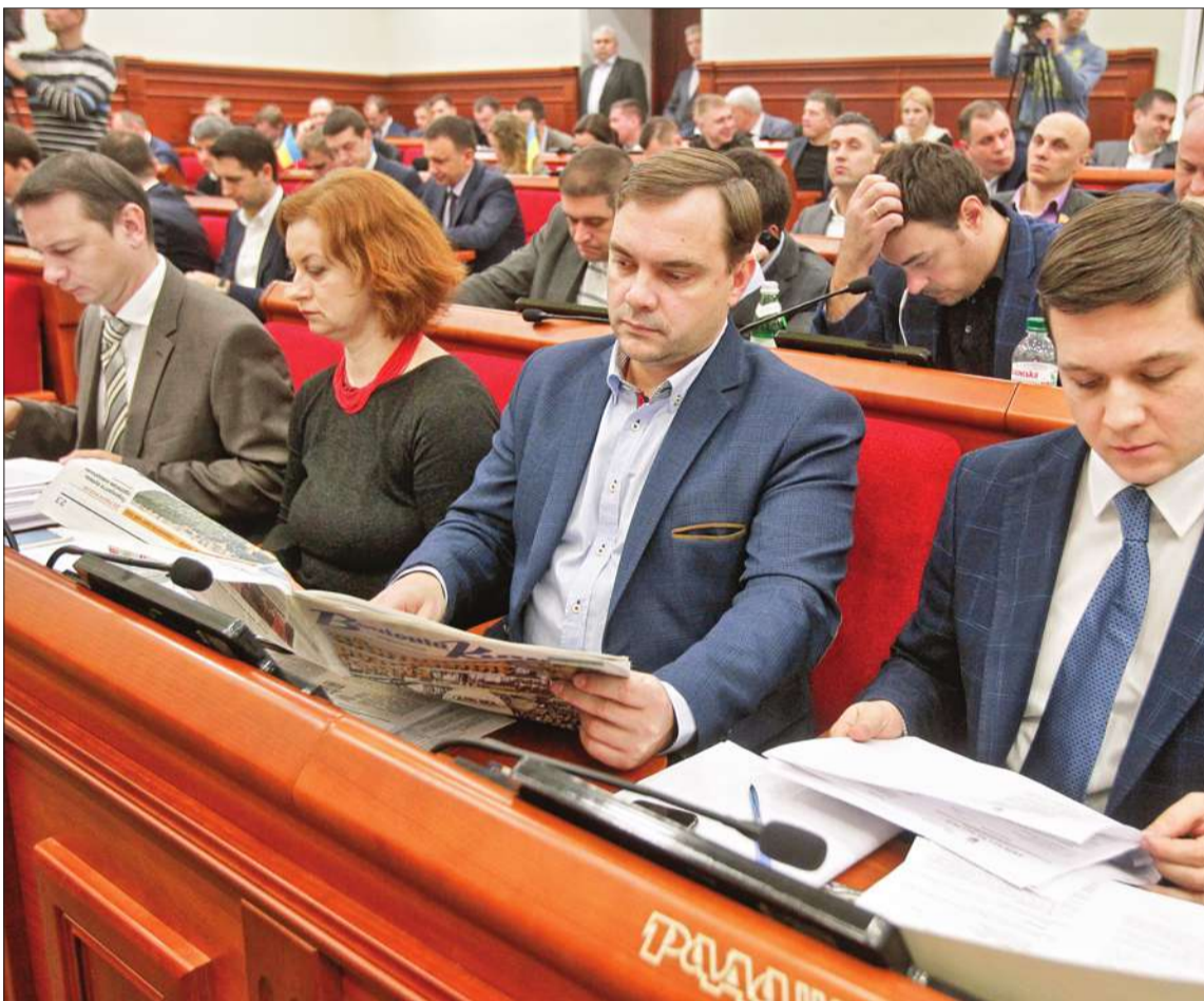
Серед ключових тем, які вчора обговорювали на сесії Київради — громадський бюджет міста, нагальні зміни до цільових програм, зокрема «Київ-інформаційний» за яку проголосували 72 депутати

Автором проекту може бути не лише киянин, а й мешканці інших міст та іноземці. Ініціатива може стосуватися — благоустрою, інфраструктури, ремонту будинку тощо. У документі передбачено поділ проектів на великі та малі, в залежності від вартості.