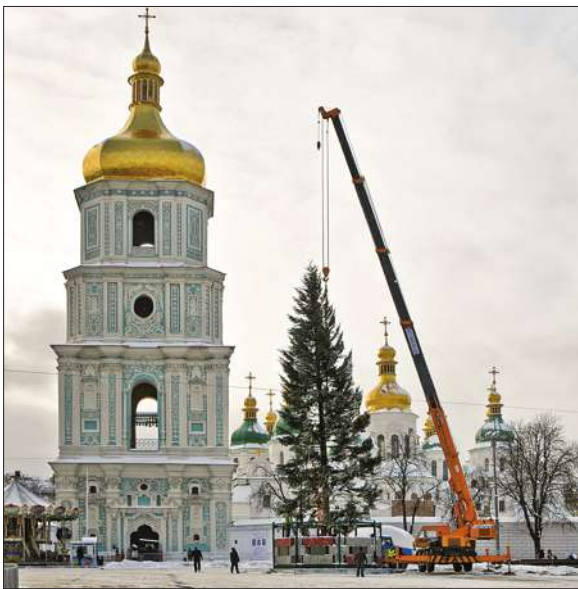
ГОЛОВНУ лісову красуню України з Івано-Франківщини вже привезли до столиці. На Софійській площі

щі комунальники почали її встановлювати. Третій рік поспіль до новорічно-різдвяних свят у Києві обирають ялицю білу. І все через непримхливість та красу. Дерево може довго стояти без води і має 7-метровий розмах гілок. Цьогорічній лісовій красуні — 86 років. Заввишки вона — 26 м. А діаметр стовбура — 52 см. Прикрасять її яворівськими забавками. Переважно це будуть іграшки з осики, адже вважається, що вона має властивість відганяти все лихе. Офіційне відкриття головної ялинки України традиційно відбудеться 19-го грудня — у День святого Миколая.