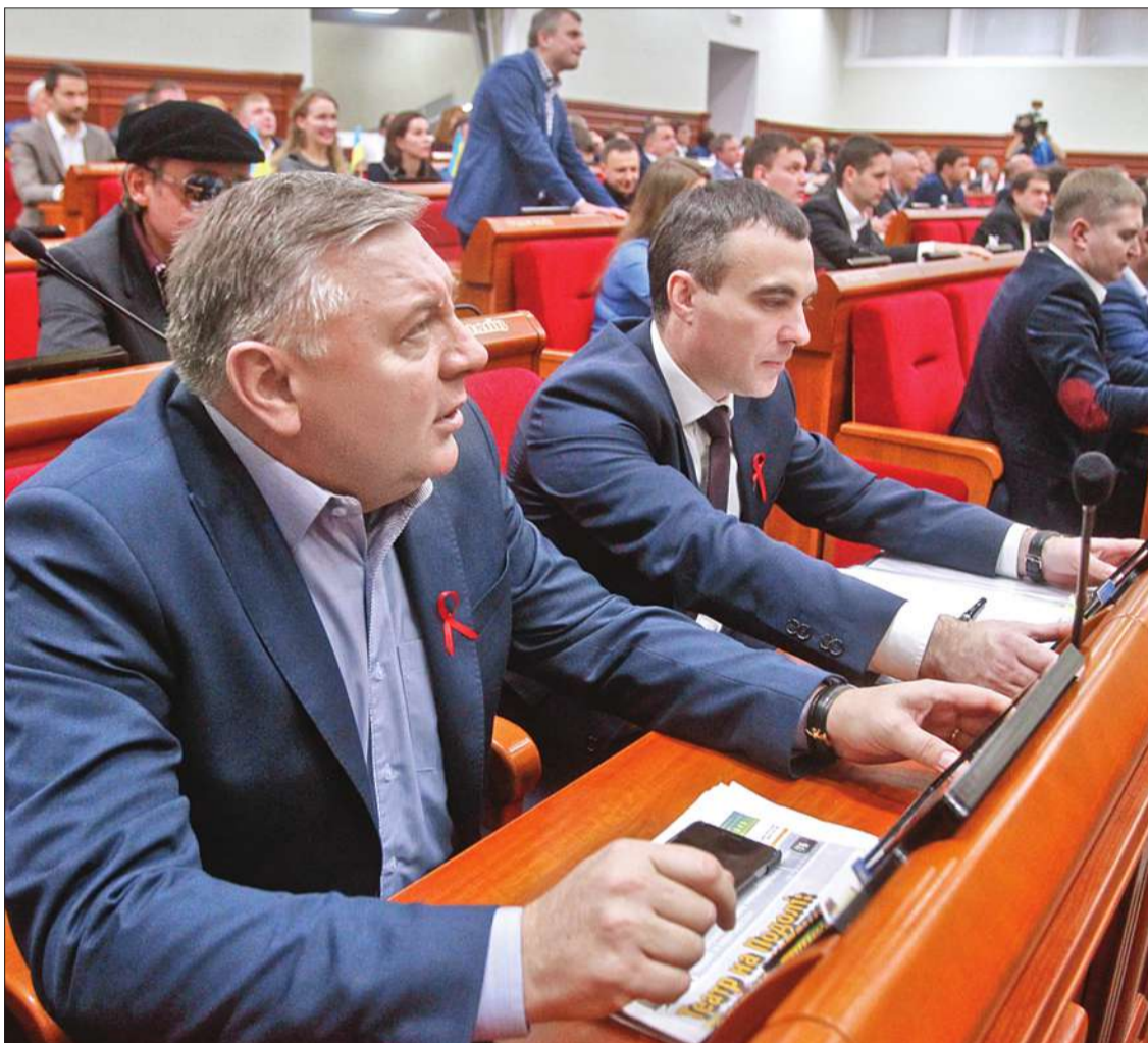
Учора депутати міськради розглядали проект бюджету Києва на 2017-й рік, опрацьовували всі пропозиції, які надійшли та алгоритм дій щодо його ухвалення. Вже на найближчих засіданнях кошторис столиці має бути ухвалений у цілому

«Сьогодні ми маємо зробити перший крок до ухвалення основного фінансового документу столиці — розглянути проект рішення, оперативно опрацювати пропозиції депутатів, фракцій, постійних комісій, які ще будуть. Та на найближчих засіданнях проголосувати за бюджет Києва на наступний рік», — зазначив міський голова Віталій Кличко.