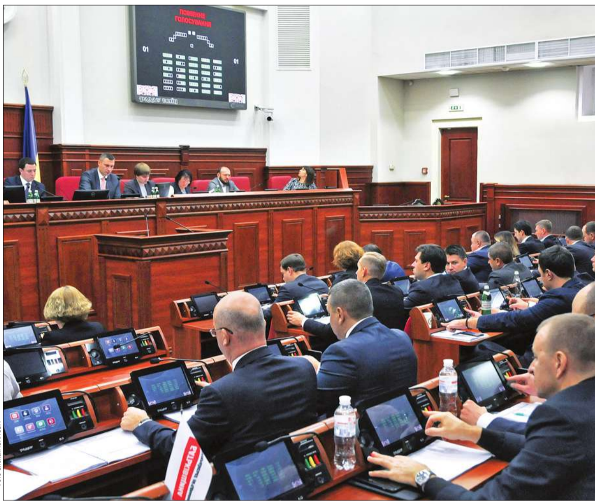
Попри вечірній інцидент у сесійній залі учора депутати Київради скоригували бюджет столиці, збільшивши видатки на охорону здоров'я, освіту, ЖКГ, безпеку і допомогу сім'ям загиблих учасників АТО та Небесної Сотні

Та найбільшу суму пропонується спрямувати на програму со-