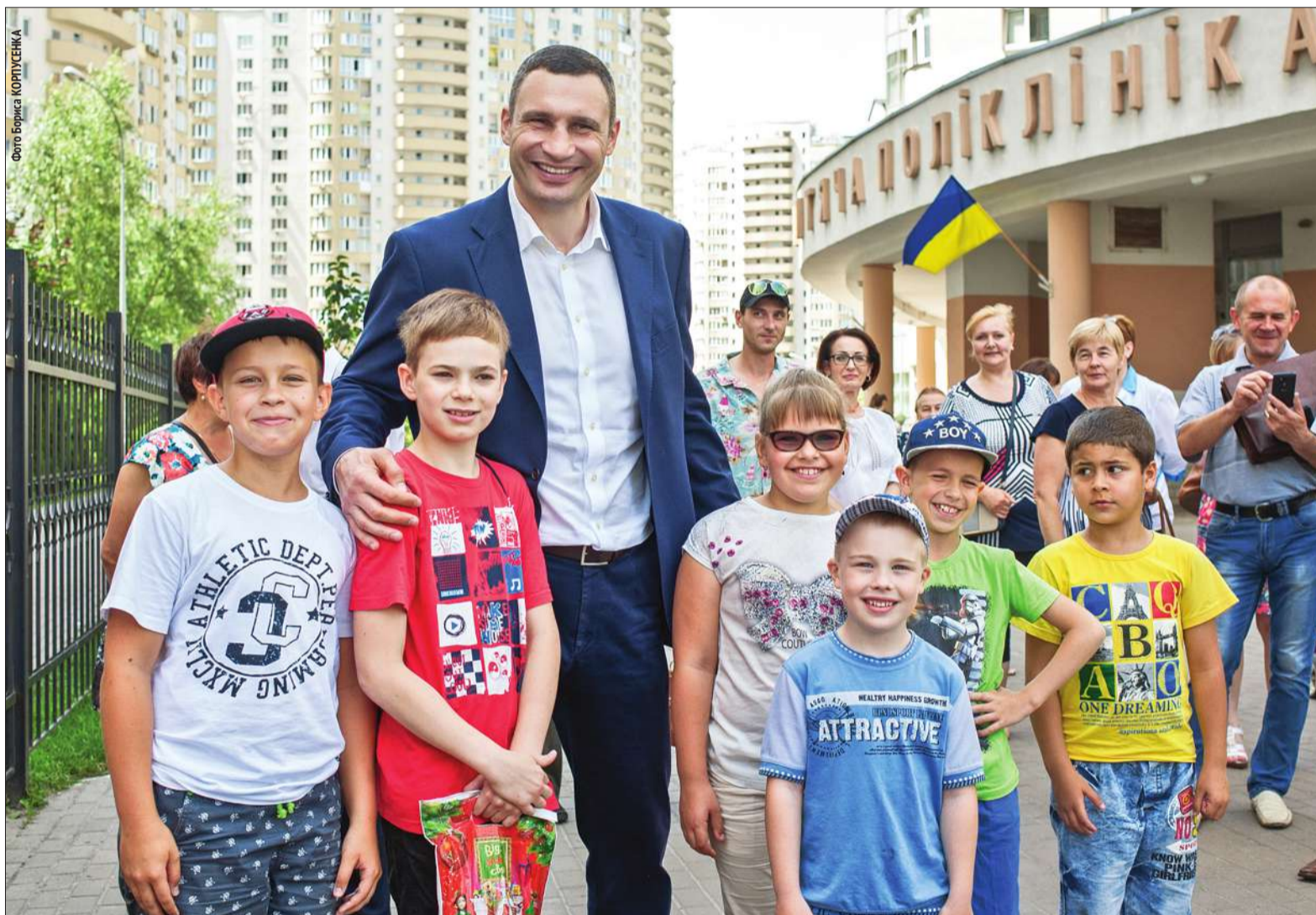
Під час візиту до Київського міського дитячого діагностичного центру мер Києва Віталій Кличко поспілкувався з маленькими відвідувачами закладу

Протягом тривалого часу Київський міський дитячий діагностичний центр на Урлівській, 13 нагадував валізу без ручки. Сучасне приміщення із дорогою медичною апаратурою, яка не працювала з тієї чи іншої причини. Скарги батьків, на «добро-вільно-примусові» внески та брак фахівців не сприяли добрій славі закладу. Проте мало-помалу ситуація почала змінюватися — апаратуру відремонтували, басейн запустили, прийшли працювати нові лікарі. Днями з перевіркою до КМДДЦ, завітав мер столиці Віталій Кличко.