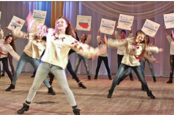
Церемонія нагородження переможців розпочалась із виступу юних волонтерів