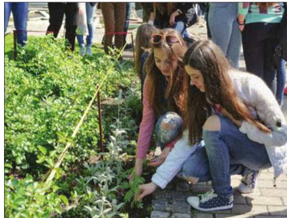
Традиційно залишається екологічна акція «Алея Прес-весни», висадка чорнобривців на дворику Київського Палацу

ЩОРОКУ в листопаді оргкомітет Міжнародного фестивалю-конкурсу обирає актуальну тему. Цьогоріч вона зачепила кожного — «25 — моєї державі», адже саме у цьому році країна відзначатиме ювілей.