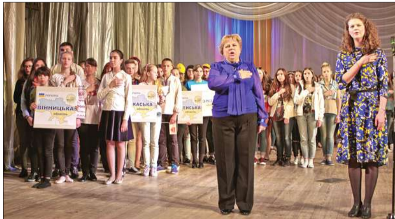
Географія фестивалю цього року досить різноманітна: до Києва приїхали гості з 18 областей України, а також юні медійники з Польщі, Білорусі та Голландії

Ярослав ЯЦЕВСЬКИЙ, Наталія ПЛОХОТНЮК спеціально для «Хрещатика»