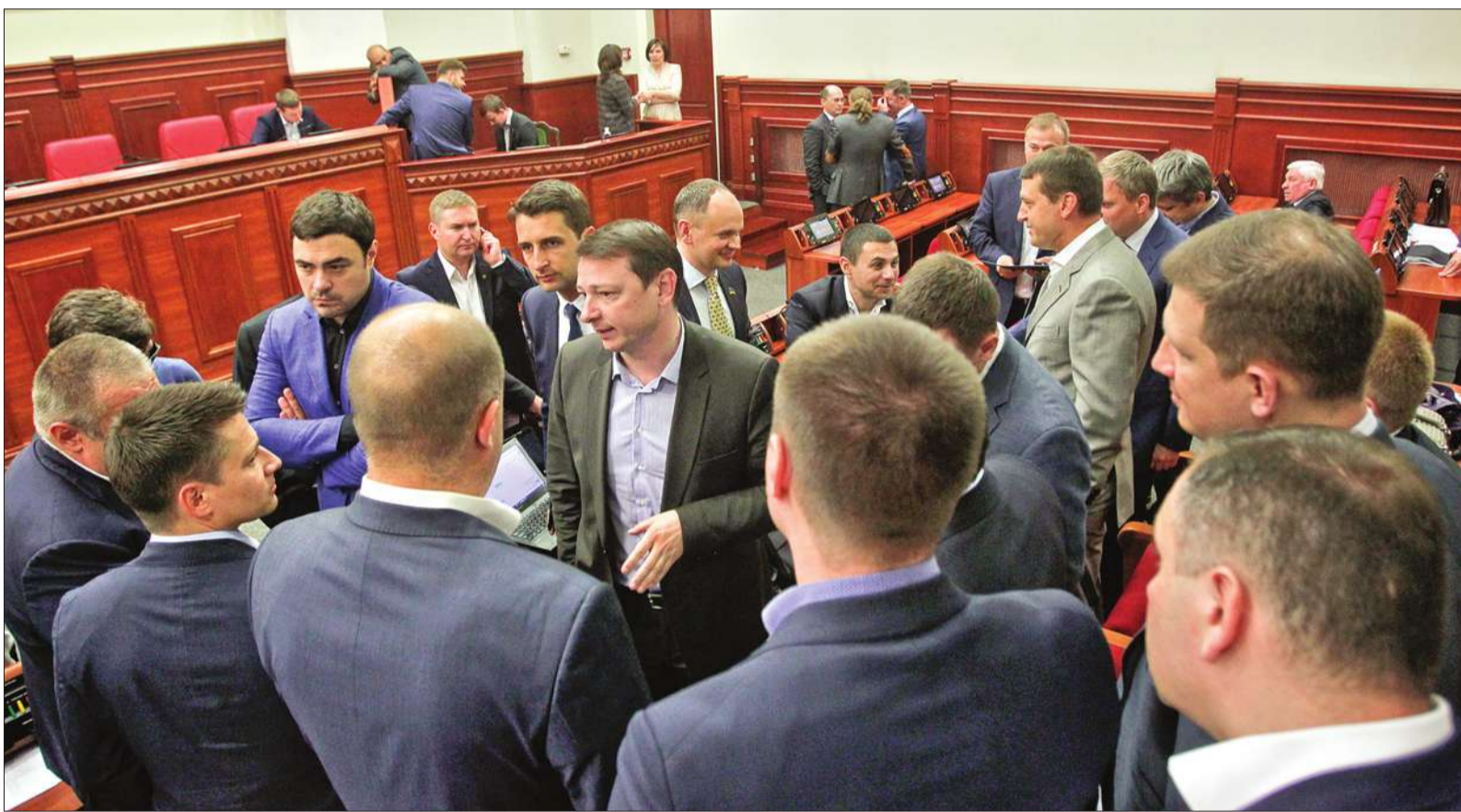
Учора чергова спроба продовжити пленарне засідання Київської ради від 21 квітня розпочалася так, як і дві попередні, — блокуванням

У фільмі «День бабака» головний герой доти не може розпочати нову добу, доки не виправить помилку старої. Реаліті-римейком цієї картини можна назвати пленарне засідання Київської ради від 21 квітня, яке тричі розпочиналося, та не мало результату, а 17 травня депутати стартували з блокади. Вочевидь, Київська рада перебуває у кризі, що поглиблюється. І доки вищий орган самоврядування столиці не виправить власні помилки, роботи не буде.