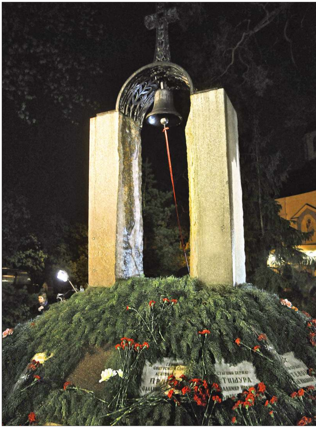
О 1.24 — саме у час вибуху на ЧАЕС 26 квітня 1986 року — над меморіальним курганом героїв Чорнобиля 30 разів вдарили у дзвін — по числу років, з моменту техногенної катастрофи