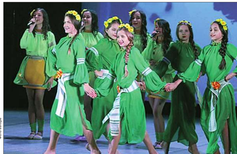
У Мінську колектив сучасної хореографії «Фламінго» КПДЮ виборов призове II місце у своїй номінації серед майже тисячі своїх однолітків

Гості фестивалю мали можливість познайомитись з прекрасним містом, відвідати меморіальний комплекс «Хатинь» — спалене фашистськими загарбниками село разом із його мешканцями. «Особисто нас чи не найбільше вразив пам'ятник воїнам-афганцям на «Острові Сліз» посеред річки Неміга й те, що в Білорусії й, зокрема в Мінську, процвітає так званий «культ спорту». Майже в центрі міста й на його околиці — величезне Олімпійське містечко: Дім футболу й Дім хокею, Дім тенісу й Дім греблі, Дім фітнесу й гімнастики, вело-мототрек і кінно-спортивний центр, аероклуб... І це — далеко не повний перелік спортивних закладів столиці Білорусі. І всі вони не просто діють, а процвітають!» —