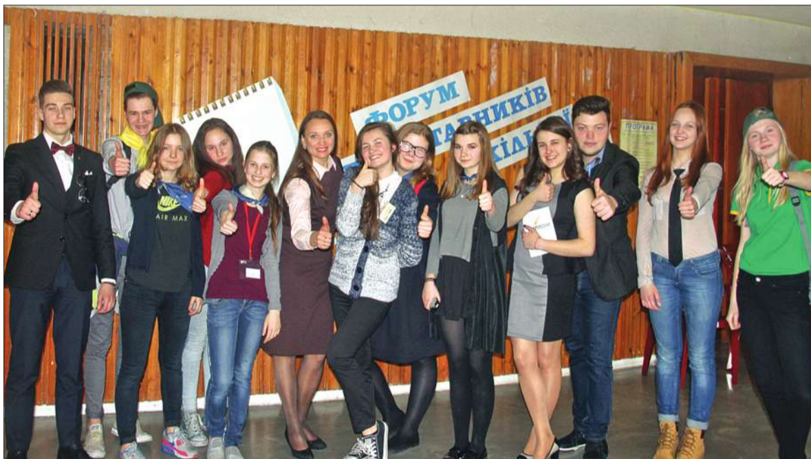
Участь у щорічному Форумі «Медіасвідомість молоді у соціальному середовищі» взяли юні журналісти з усіх столичних районів

Викладачі вишів розповідали майбутнім журналістам про свої навчальні заклади, про пільги для переможців «Прес-весни», про най-