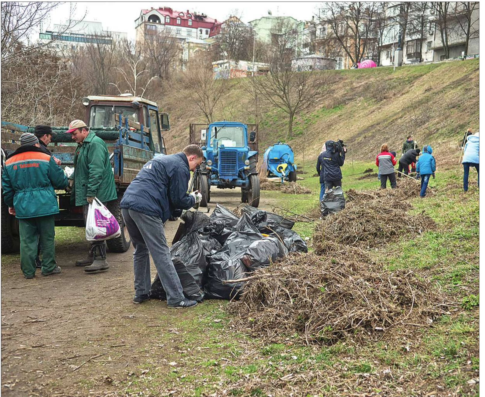
У суботу керівники міста разом з мешканцями столиці та громадськими активістами наводили лад в одному з наймальовничіших куточків Києва — на Пейзажній алеї

■ Під час суботньої толоки мер міста разом з киянами наводив лад в одному з наймальовничіших куточків столиці