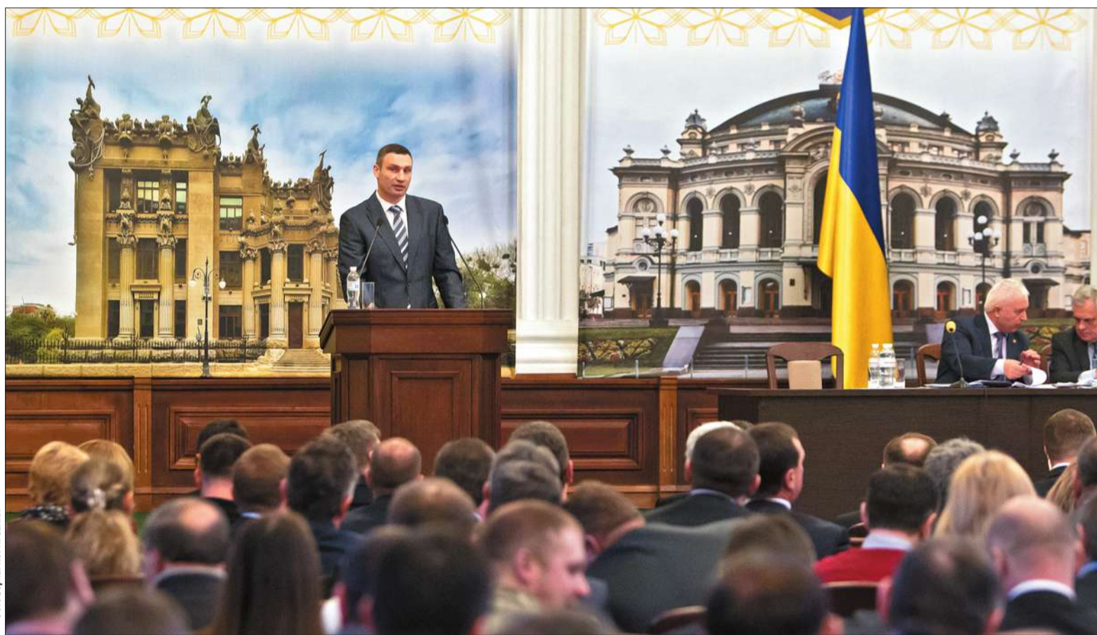
Робота столичної влади отримала всеукраїнське визнання — мера Києва Віталія Кличка обрано головою впливової Асоціації міст України

Те, що столиця України запроваджувала новації децентралізації найпершою, знали всі. Робота столичної влади отримала всеукраїнське визнання — мера Києва Віталія Кличка обрано головою впливової Асоціації міст України. Але попереду не лаври, а копітка, складна й надзвичайно відповідальна робота.