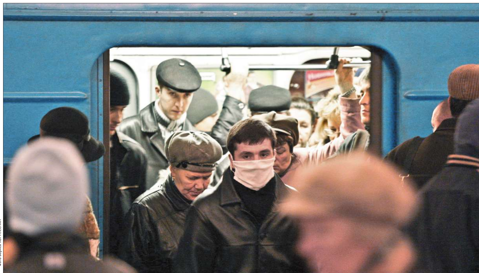
Хоча рівень захворюваності на грип у столиці не перевищує епідпоріг, у місті запровадили профілактичні запобіжні заходи

■ Аби не допустити масштабного спалаху захворюваності на грип та ГРВІ, у місті запровадили профілактичні запобіжні заходи