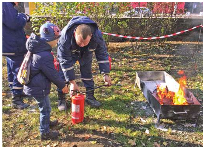
По-справжньому спекотною атмосферою була біля майданчика рятувальників — за годину його встигали відвідати до 300 дітей

У заході взяли участь і працівники патрульної поліції. Вони ознайомили юних учасників з правилами дорожнього руху, а