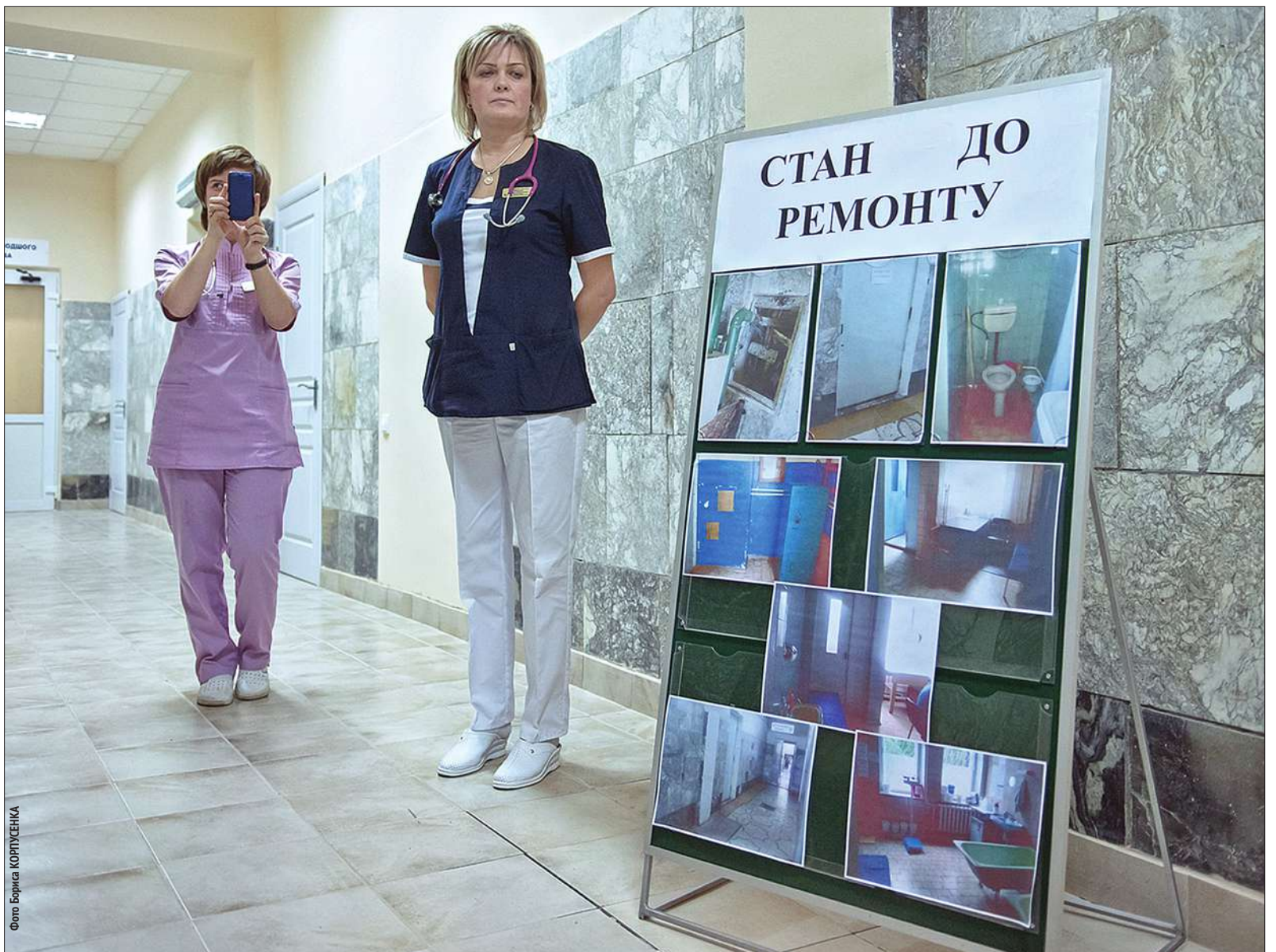
Під час відкриття оновленого приймального відділення дитячої клінічної лікарні № 4 Солом'янського району (на фото) можна було побачити, як виглядав медзаклад до капітального ремонту, та як змінився після реконструкції

У медмістечку після капітального ремонту відкрили приймальне відділення дитячої клінічної лікарні № 4 Солом'янського району