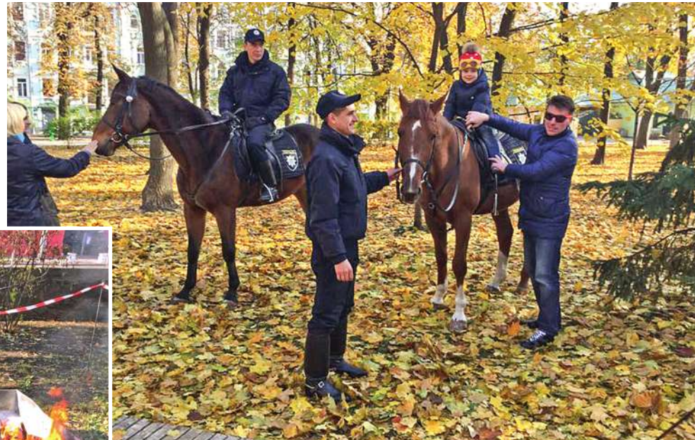
Також було людно і біля коней працівників міліції — аби проїхатися хоч одне коло верхи, малюки задалегідь займали місця у черзі

«Сьогодні в Україні недостатньо спеціалістів з логістики, тож на нашій локації юні учасники заходу пізнавали, що це таке: склали робіт з коробочок, переміща-