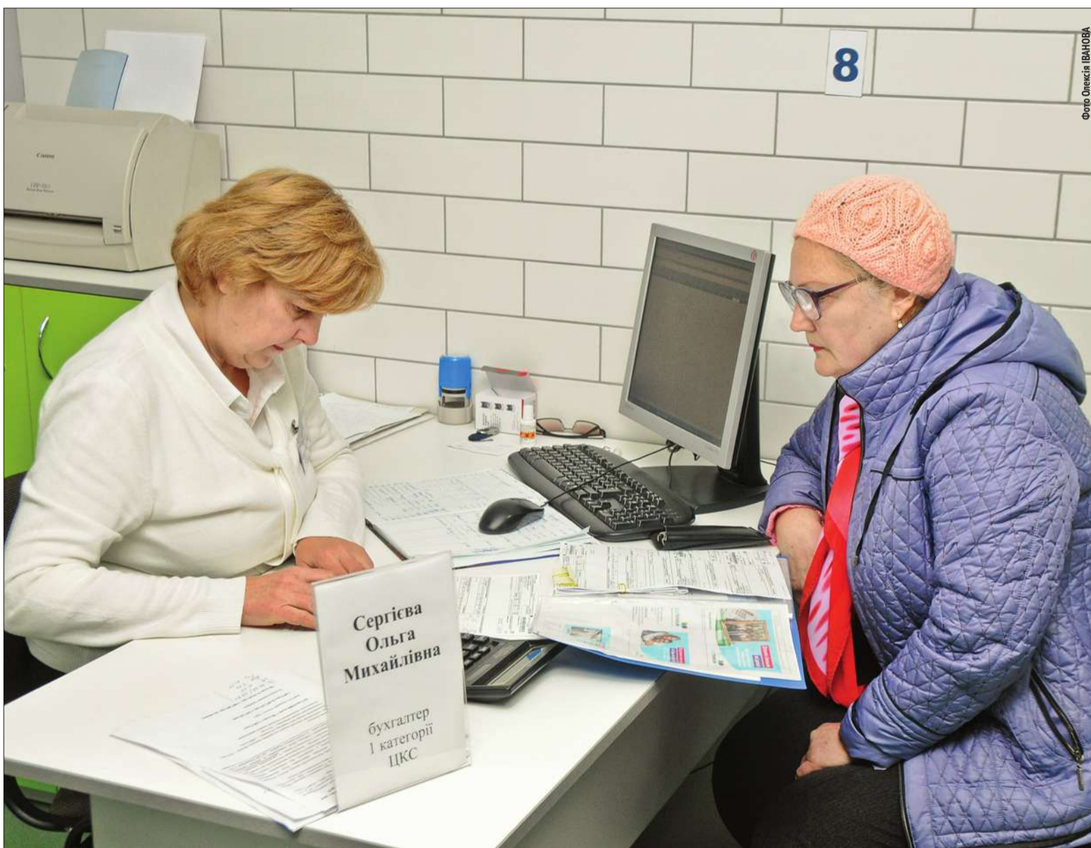
Віднедавна в сучасному інформаційно-консультативному центрі святошинці можуть отримати понад 40 видів послуг з житлово-комунальної сфери

■ У столиці запрацював перший сучасний центр надання якісних послуг та консультацій з комунальних питань