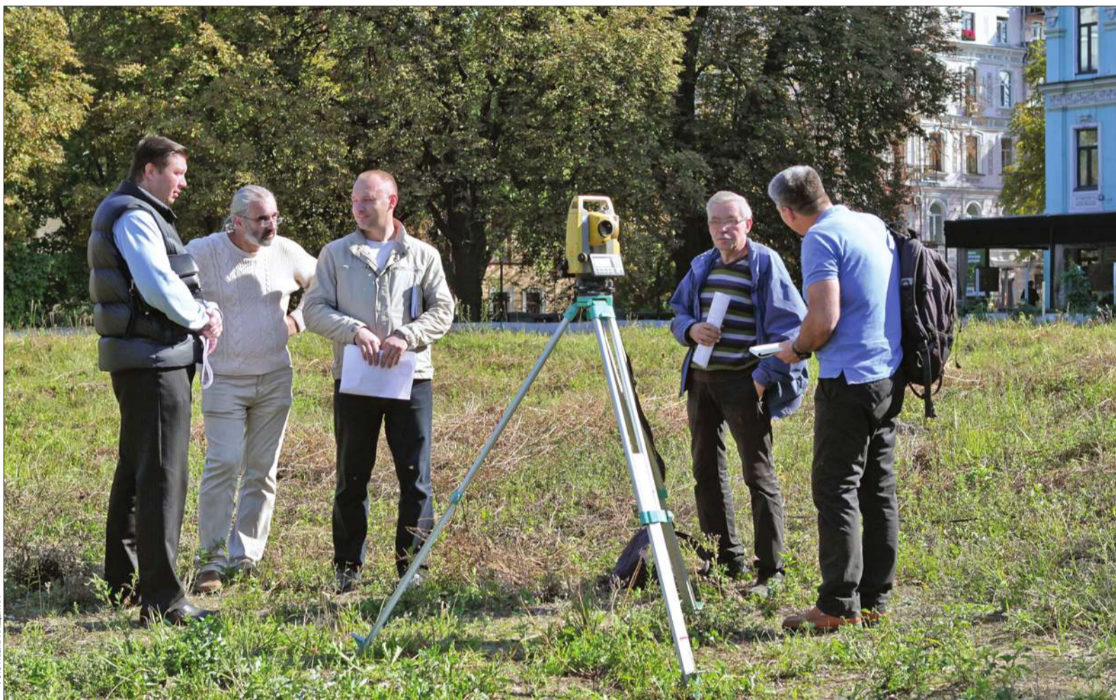
Нинішній старовинний фундамент церкви Пресвятої Богородиці Десятинної, побудованої в X столітті, фахівці планують законсервувати, а на його місці встановити новий

■ До кінця цього року у столиці відтворять точний контур фундаменту старовинної Десятинної церкви