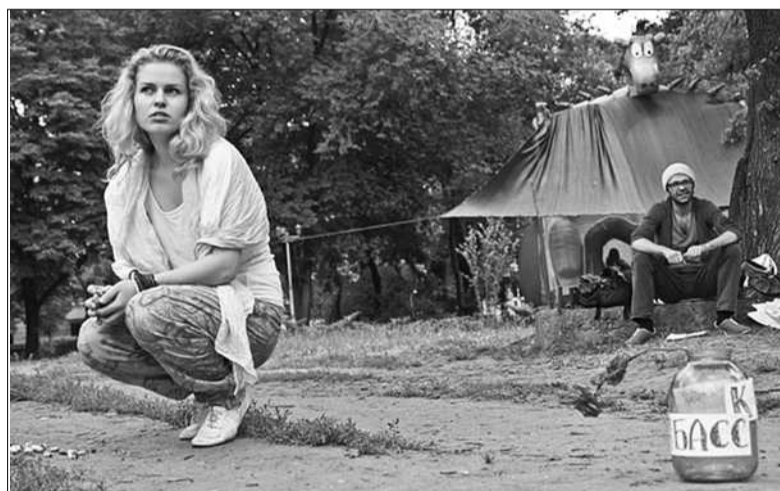
Кістяк форум-театру складають переселенці з Криму, а також мешканці столиці та різних регіонів України

сті трагедії країни. Бере за душу сповідь відомої кримської блогерки Лізи Богущької «Ви всі мої сини», яка розповідає, як їздила містом, спілкувалася з російськими солдатами, намагалася дати їм зрозуміти, що ми їм — не вороги: «Я знала точно, що приїду завтра, після завтра, й вони складуть зброю,