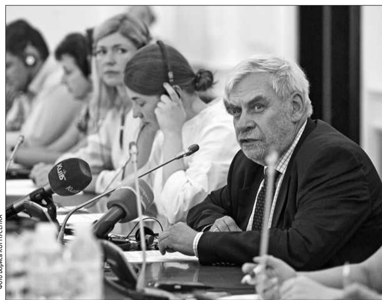
Під час семінару в столичній мерії польський професор Войцех Місьонг поділився досвідом із проведення реформи в місцевому самоврядуванні, а також з бюджетної децентралізації

мають майно. Державні органи можуть втручатися в органи місцевого самоврядування лише в тому разі, якщо вони порушують закон», — зазначає пан Войцех. Самоврядування в Польщі розділене на гміни, повіти та воєводства. Найважливіший аспект реформи в Польщі — це коли громади відчували, що вони можуть дбати за свої доходи. «Громада в Польщі утримується від податків. В сільській місцевості найбільше значення мають трансфери з бюджету. Це впливає з того, що в Польщі сільське господарство легко оподатковане. А коли ми переходимо від сільських до міських громад, то найбільше значення мають власні доходи, це доходи від майна громади і податки від прибутків мешканців. І система збудована таким чином, що вона дає достатню кількість доходів і багатшим, і біднішим громадам. Самі жителі вибирають свою владу. Влада