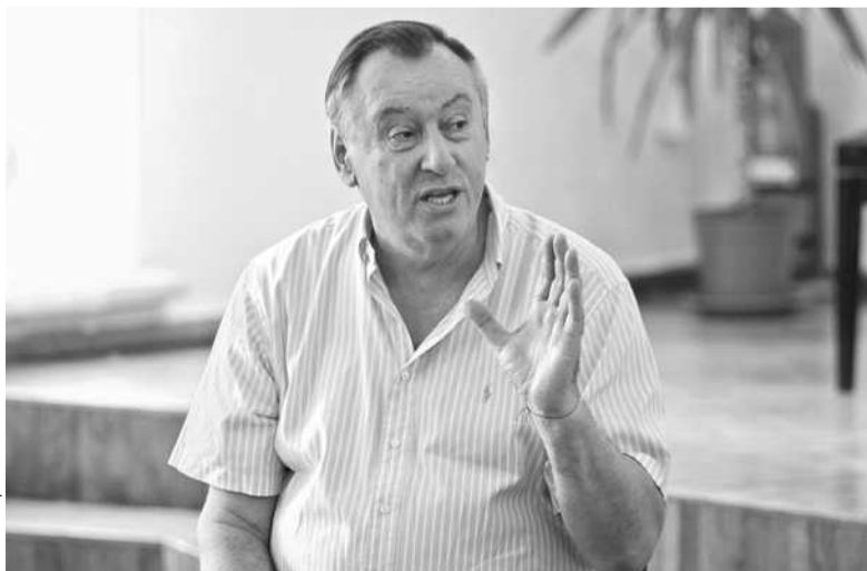
Анатолій Кочерга розповів про перший контракт та екстраординарні оперні постановки

В Україні це ім'я є знаковим передусім для меломанів покоління 1970—80-х. Для молодих він представник іншої епохи й іншої вокальної традиції (школи Шаляпіна, Іяурова, Гмирі), наслідувати яку сьогодні чомусь дуже складно. Переконати в цьому можна було і на майстер-класі Анатолія Івановича 2011 року