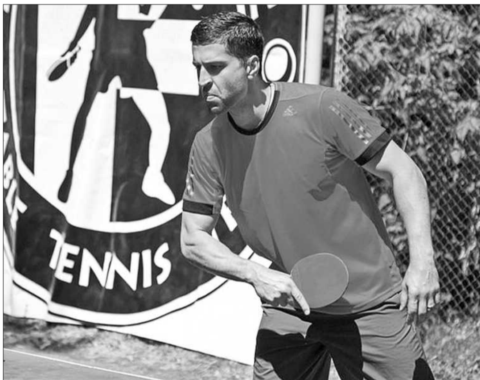
У першому тенісному турнірі пам'яті Віктора Роди взяли участь 62 спортсмени

Віктор Єфимов — гравець збірної України з настільного тенісу, чемпіон клубного чемпіонату України. «Турнір проводився на честь тренера, якого я дуже поважаю й якого вже з нами немає, та ця людина брала участь в моїй спортивній