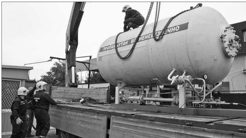
У ході перевірки заправки газ було відкачано, бочку, в якій він знаходився, демонтовано й відвезено евакуатором на штрафмайданчик

ЗА ДОРУЧЕННЯМ міського голови Віталія Кличка управління з питань надзвичайних ситуацій КМДА спільно з ДСНС та Департаментом благоустрою, а також депутатською комісією вчора провели перевірку столичних газових автозаправок на предмет безпеки.