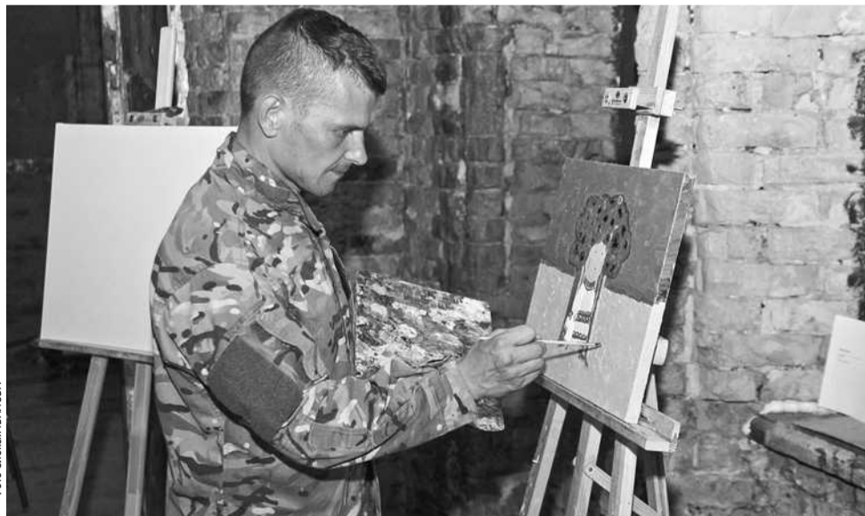
Проект покликаний перевести військову енергію ветеранів АТО в мирне русло

ним живописом з хлопцями, які повернулися з АТО. Це виявився не просто майстер-клас, а повноцінні роботи, які захотілося показати людям, долучити інших. Крім того, заняття дають змогу відпочити душею, реалізувати себе в творчості. 26—27 червня на форумі «Народна оборона» в «Мистецькому Арсеналі» плануємо представити свої майстер-класи та виставку робіт. Якщо будуть цікаві експонати, проведемо аукціон. До того ж 24 серпня хотіли би влаштувати фестиваль ART-Комбат».