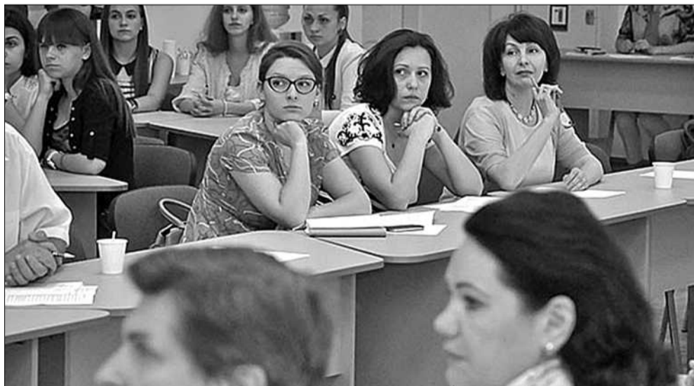
У Київському університеті імені Бориса Грінченка відбувся «круглий стіл» з обговорення законопроекту «Про столицю — місто-герой Київ»

Ірина ЛАБУНСЬКА | спеціально для «Хрещатика»