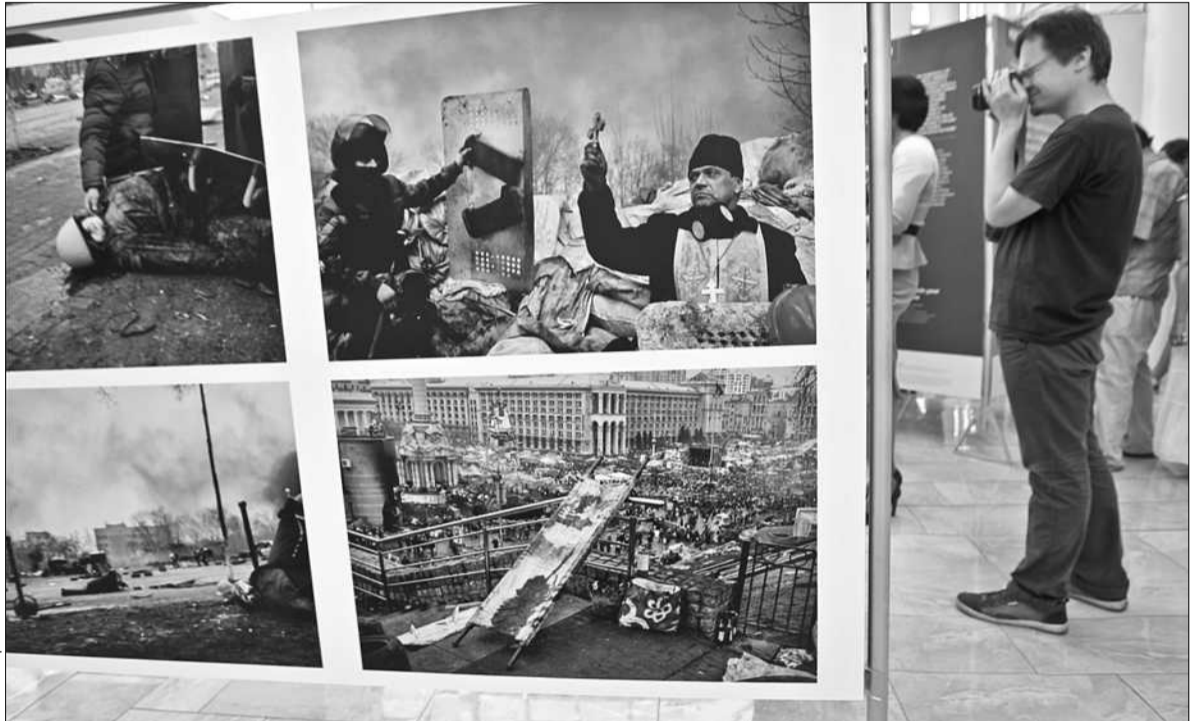
Серед фіналістів WPP — знімки, присвячені трагічним подіям в Україні

■ В Києві показують найважливіші журналістські світлини року