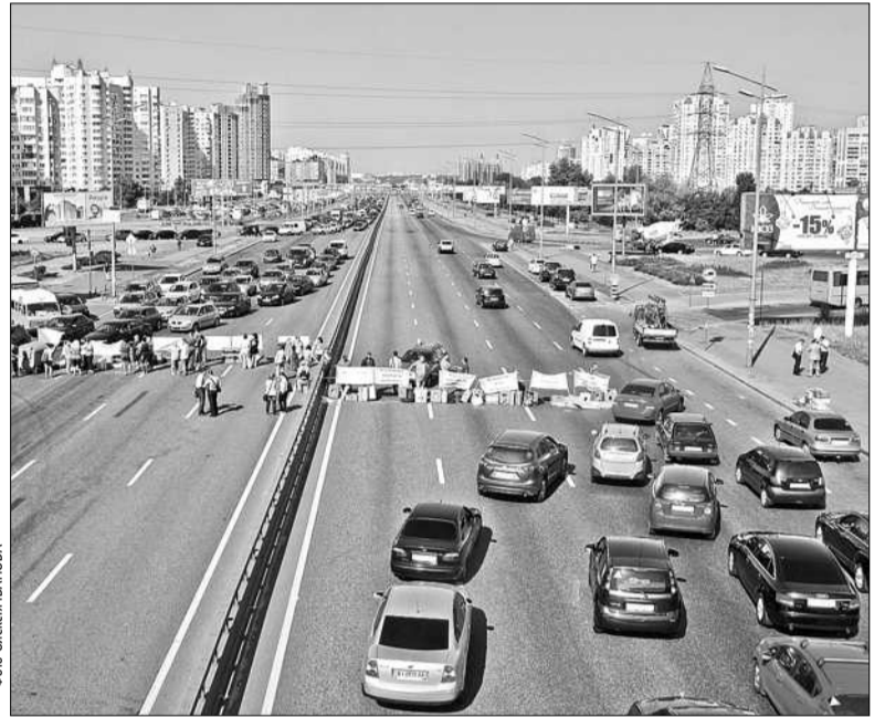
Учора біля метро «Харківська» приблизно 50 осіб перекрили рух в обидва боки по проспекту Бажана через демонтаж МАФів

На ситуацію міський голова відреагував блискавично. Але на шантаж не повівся. Він заявив, що кияни вимагають навести лад зі стихійною торгівлею і очистити міс-