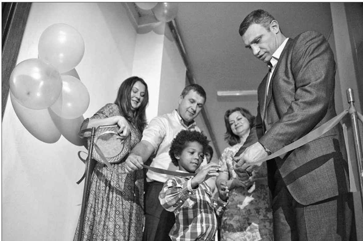
Мер Києва Віталій Кличко взяв участь у відкритті 20-го — ювілейного — дитячого будинку сімейного типу і урочисто вручив батькам-вихователям, родині Брагінців, яка виховує чотирьох прийомних дітей, ордер на квартиру

■ Міська влада подарувала квартиру родині Брагінців, яка виховує чотирьох прийомних дітей