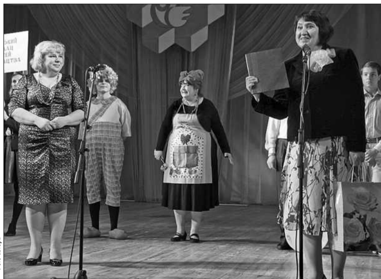
З нагоди 80-річного ювілею в Київському палаці дітей та юнацтва відбулися урочисті заходи

діли науково-технічної творчості, туризму, краєзнавства та патріотичного виховання, біології, менеджменту та інформаційно-комунікаційних технологій представили інтерактивну виставку за напрямками: «Цікава наука», «Розумний дім», «Колекція відкриттів», «Наука на захисті Батьківщини». Під час цікавих майстер-класів діти й дорослі мали змогу доторкнутися до наукових відкриттів і ознайомитися з сучасними методами досліджень, подивитися на надзвичайно цікаві фільми в мобільному сферичному кінотеатрі FULLDOME: «10 кроків крізь небо», «Дивовижний телескоп», «Гублячи зірки». Особливу цікавість викликали пожежний автомобіль і гасіння навчальної пожежі, показані Печерським управлінням МНС України, автомобіль-лабораторія УКРНАФТОГАЗГЕОФІЗИКА концерну «Надра», колекція телескопів від Клубу аматорів України «Astropolis», 3D-принтери від компанії Flabers, військове споряджен-