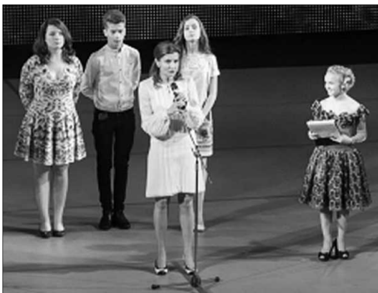
Дружина Президента України Марина Порошенко разом з дітьми – Олександром, Євгенієм та Михайлом взяла участь у гала-концерті «Палац! Родина! Україна! – єднаймося!»

1934–1941 рр. характеризувалися масовим відкриттям в Україні, як і в СРСР, комплексних позашкільних закладів нового типу – палаців піонерів та жовтенят. Перший в СРСР Палац піонерів і жовтенят було відкрито влітку 1934 року у Харкові, а коли уряд УРСР переїхав до Києва, за ініціативою секретаря ЦК ВКП(б) П. П. Постишева, у розпорядження дітей було передано будинок колишнього Купецького зібрання (нині тут Філармонія). Першими гуртками Палацу піонерів були шаховий, туристичний та юних техніків і водна станція. У 1934-му в Києві відбувся перший Всеукраїнський зліт юних друзів оборони. Виходили піонерські газети «Піонерський форпост» і «Сталінські квіти». У грудні 1943 року майже відразу після звільнення Києва від німецько-фашистських окупантів у колишньому будинку командувача військовим округом (вул. М. Грушевського, 32, нині тут – Посольство Китаю в Україні) розпочинає роботу Палац піонерів. Сучасна будівля головного корпусу збудована у 1962–1965 роках на місці зруйнованого за тридцять років до цього Микільського військового собору і прилеглих до нього будівель. Трохи пізніше до основної будівлі прибудували Лабораторний корпус.