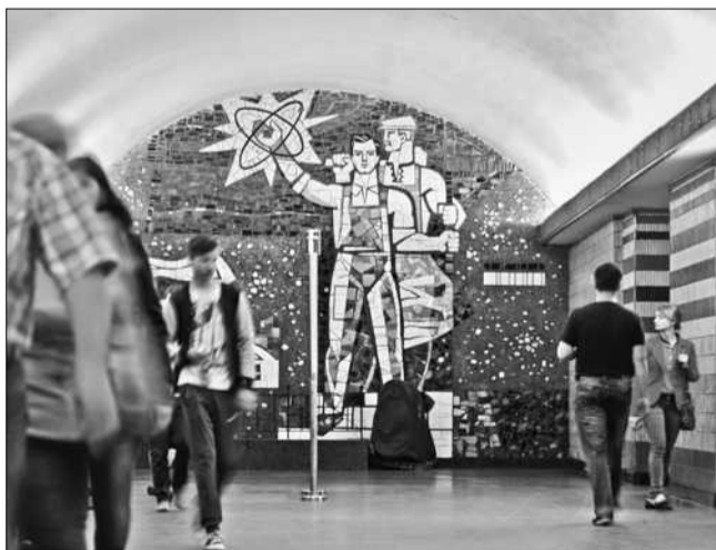
Щодо метро «Шулявська», то композиція на цій станції у 1963 році, за словами фахівців, була визнана новаторською у світі

Проте вже зараз до комісії Київради з питань культури та туризму звернулася організація Національної спільки художників України з тим, щоб депутати уважно підходили до кожного