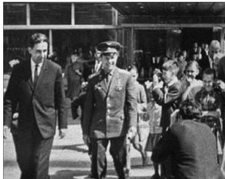
Свого часу почесним гостем Палацу був перший космонавт планети Юрій Гагарін

ня та броньована амуніція, розроблена й виготовлена київськими науковцями й практиками спільноти «Арсенал патріота» для українських військових із зони АТО та універсальний камуфляж ХИЖАК, який має 6 варіантів забарвлення, а за маскувальними властивостями на території України перевершує відомі універсальні камуфляжі MULTICAM, A-TACS (США) і MTP, PENCOTT (Великобританія).