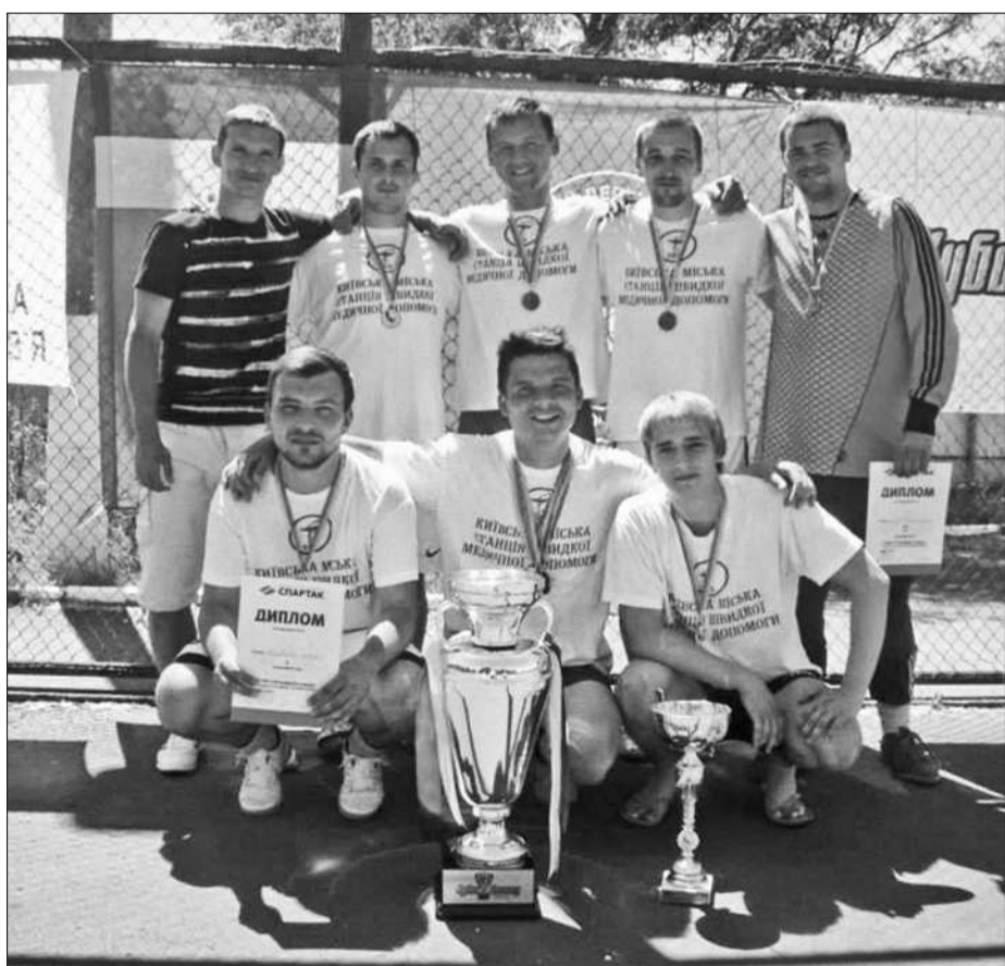
Переможці «Ігор справжніх киян» Київська міська профспілка працівників охорони здоров'я разом з перехідним Кубком змагань

■ Київська міська профспілка працівників охорони здоров'я — переможці «Ігор справжніх киян»