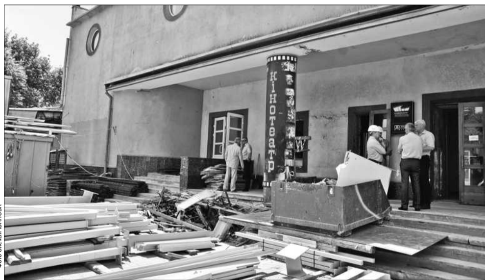
Реконструований після пожежі столичний кінотеатр «Жовтень» планує відкрити для глядачів уже у жовтні цього року