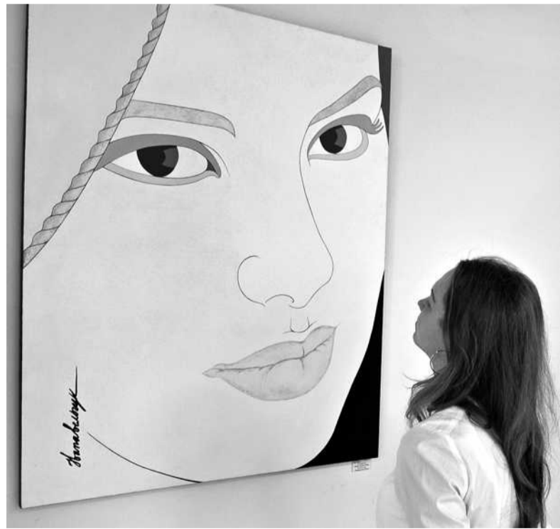
Благодійний аукціон молодих митців "АРТ А" проходить вдруге і допомагає дітям-сиротам в місті Городня

Передакційну виставку супроводжує пізнавальна програма — цикли лекцій і майстер-класів від майстрів та викладачів Академії, що відбудуться на двох локаціях. У Центрі української культури та мистецтва (вул. Хорива, 19-в) проводять майстер-класи з декпажу, виготовлення ляльок-мотанок, акварельного живопису, а також лекції про українське сакральне мистецтво, перфомативні