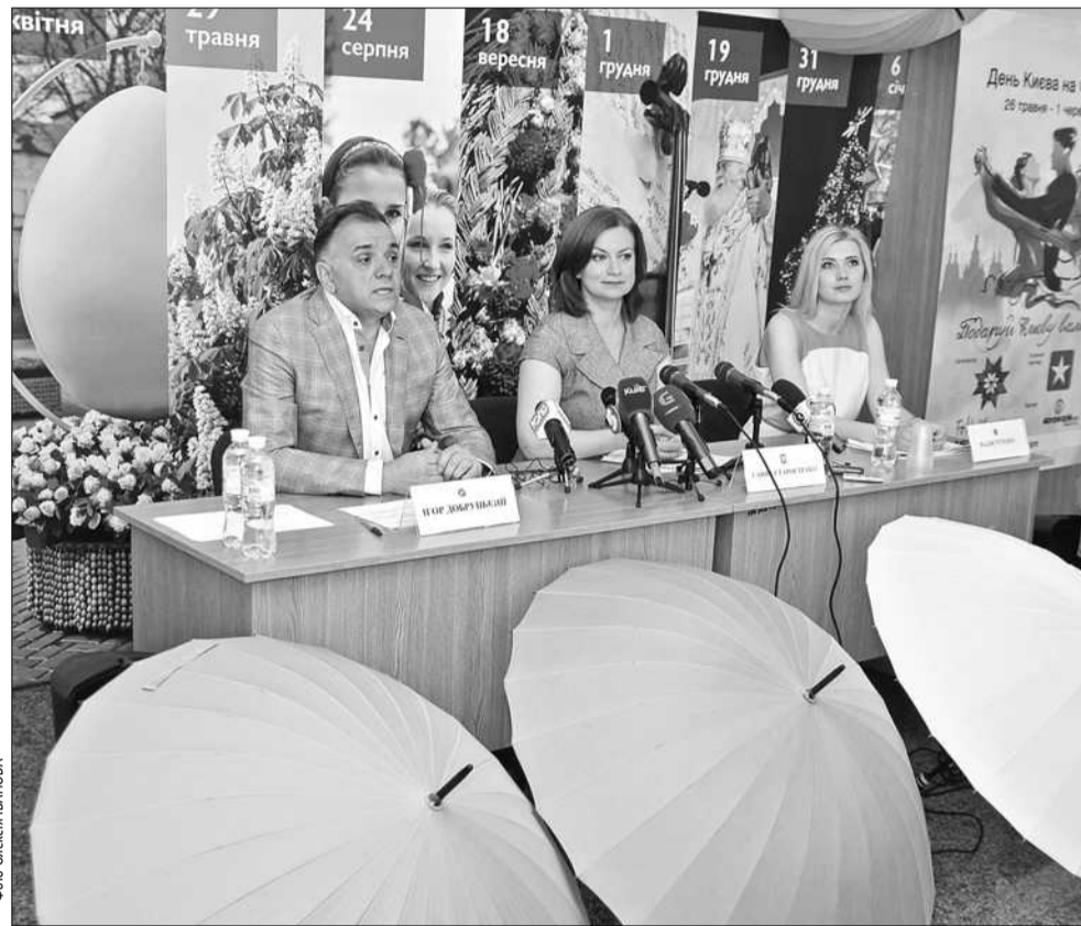
За словами організаторів, в цьому році святкові заходи до Дня Києва відрізнятимуться новизною та масштабністю