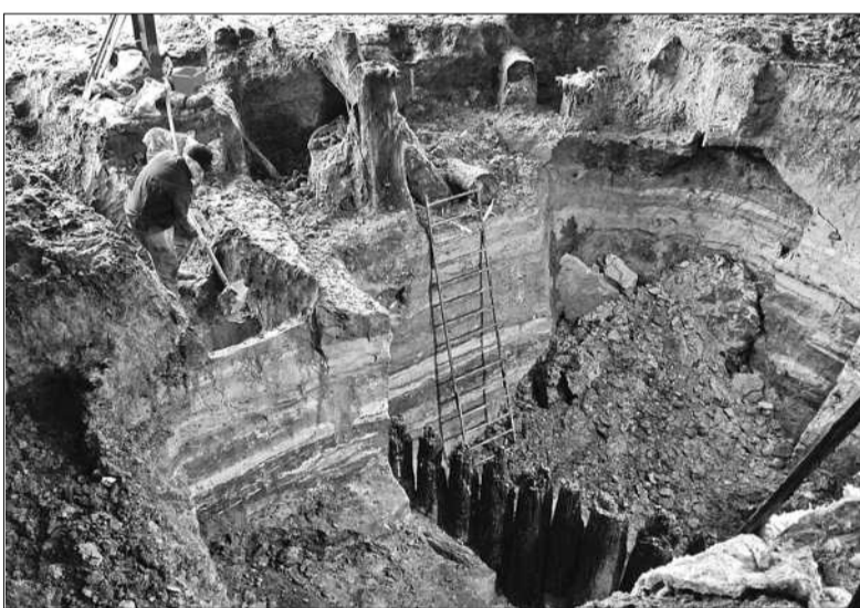
Після численних запитів фахівців і науковців міська влада припинила будівництво на Поштової площі та вирішила створити підземний музей, який знаходитиметься на базі торговельного центру

Штаб працюватиме щовівторка з 11.00 до 12.00 ■