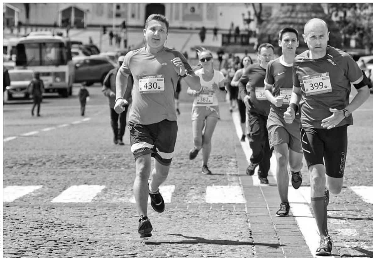
Маршрут «EuroRun 2015» проходив біля посольств країн Польщі, Італії, Чехії та Словаччини

■ В місті відбулася ціла низка заходів для активного відпочинку