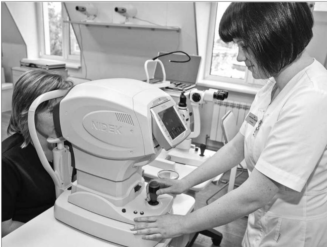
У новій клініці як для діагностики, так і для хірургії використовується обладнання останнього покоління. Це апарати VIP-класу

Також пан посол розповів, що Литва підтримує Україну: щомісяця на лікування та реабілітацію до цієї країни відправляються чотири—п'ять поранених військовослужбовців із зони АТО. У Литві вже виліковано близько ста українських бійців. Також Маріус Януконіс наголосив, що литовські інвестори вірять у майбутнє України. До того ж офтальмологічні медичні послуги користуються широким попитом.