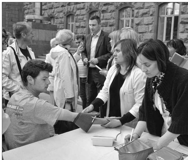
У заході на Хрещатику взяли участь майже 2 тисячі киян та гостей столиці. 30 лікарів разом із медсестрами зробили 300 електрокардіограм, взяли 570 аналізів на рівень цукру в крові

У НЕДІЛЮ всі бажані могли безкоштовно отримати консультації лікарів-кардіологів і лікарів-санологів, виміряти артеріальний тиск та рівень цукру в крові, зняти електрокардіограму, ви-