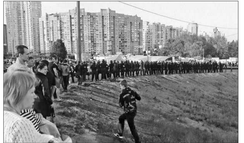
На місці проблемної забудови мер Києва пропонує облаштувати сквер