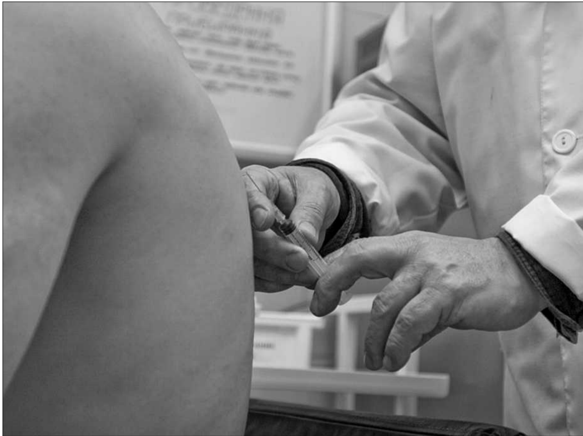
Сьогодні вакцинація — найбільш поширений метод імунізації людини

Сьогодні вакцинація — найбільш поширений метод імунізації людини. Ефективність та популярність цього методу профілактики захворювань призвела до появи нових проектів, не завжди пов'язаних із захворюваннями. Так, вченими сьогодні активно розробляються вакцини проти таких неінфекційних загроз, як нікотин та ожиріння. Згідно з публікацією в американському науковому журналі Proceedings of the National Academy of Sciences,