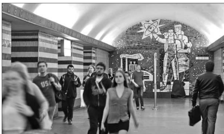
На засіданні постійної комісії Київради з питань культури і туризму депутати підтримали проект рішення "Про демонтаж об'єктів оздоблення станцій Київського метрополітену – носіїв комуністичної символіки"

■ Із демонтованих радянських символів планують створити музей