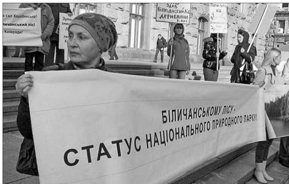
Заповідний статус мав би захистити Біличанський ліс, проте, як свідчать громадські активісти, всі загрози не ліквідовані й досі

■ Київрада шукає кошти на розробку землепорядної документації