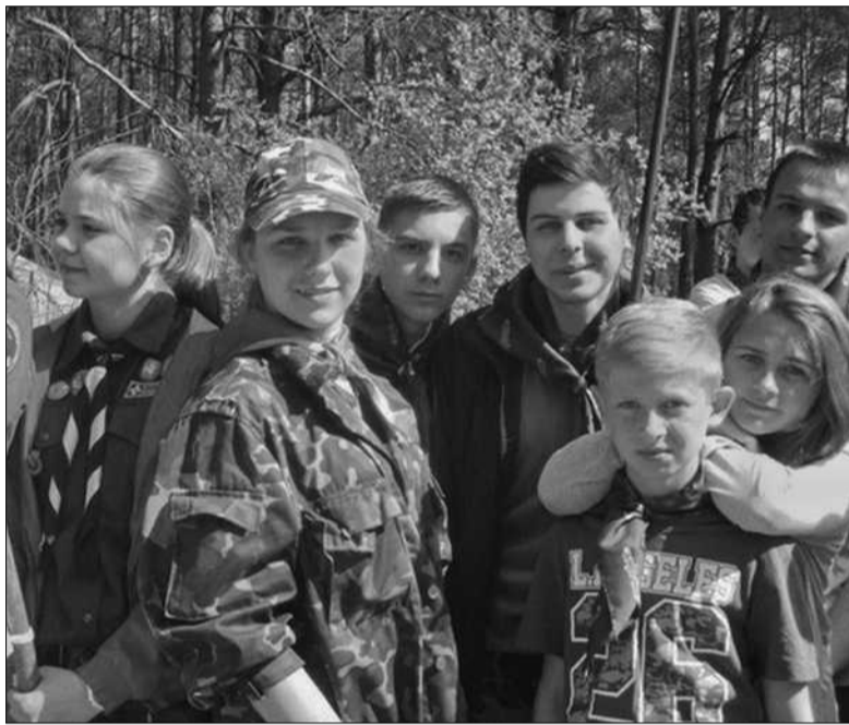
Багато цікавих пригод, нових друзів та незабутніх вражень отримали всі учасники збору-походу «Козацькими шляхами»

Олена ПЕТЮР, Дмитро ШОВКУН спеціально для «Хрещатика»