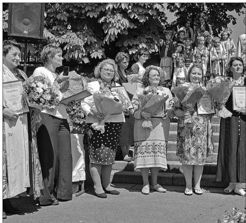
У День матері організатори влаштували в Ботанічному саду на Печерську ціле дійство з концертами, привітаннями та майстер-класами посеред Алеї троянд

мобілі обходиться у 8 грн на 100 км. Тому українці б із радістю купували такі автівки, якби змінили законодавство України і відмінити податок на ввезення цих авто. Тому компанія Shooter нині намагається популяризувати електромобілі на рівні місцевих органів влади і готує новий законопроект до Верховної Ради для того, аби українці змогли в майбутньому «розігнатися» на електрокарі ■