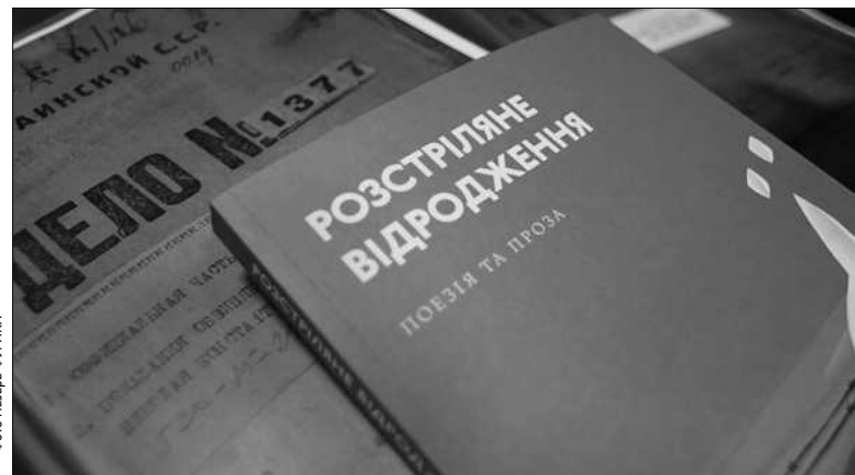
Книга звертає увагу на драматичні долі письменників «розстріляного відродження», досьє КДБ на яких нещодавно стало доступним в архівах

хівів КДБ. Видавництво «Основи» отримало дозвіл на роботу з досьє майже на усіх письменників «розстріляного відродження». Важко уявити, але їх «закладали» псевдодрузі, переказуючи спецслужбам відверті кухонні розмови. І диву даєшся, як Остапу Вишні вдалося писати гумористичні твори, коли він постійно чекав на арешт. Ці матеріали незабаром обіцяють представити у медійних проектах ■