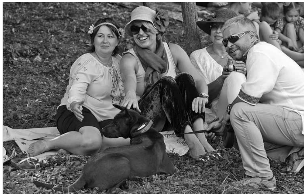
Фестиваль Kiev May-Art Picnic з концертами, виставками та розвагами триватиме на Співочому полі дев'ять днів

■ «Хрещатик» склав цікаву програму на вихідні