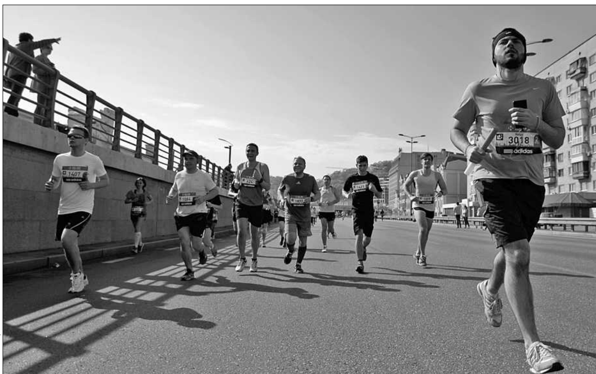
В рамках Київського напівмарафону вулицями міста пробігло 6 200 учасників з 40 країн світу

■ В місті відбувся популярний легкоатлетичний захід