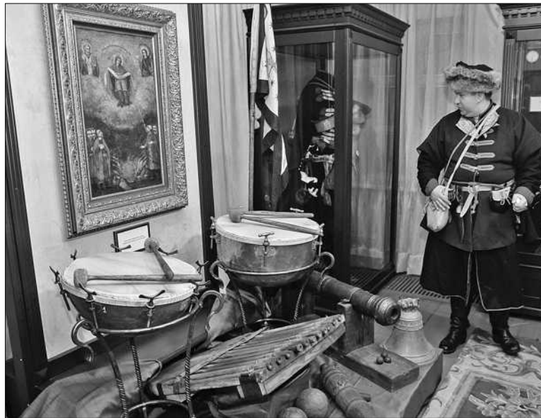
Чільне місце в експозиції займає ікона «Покрови Пресвятої Богородиці» XVIII ст.

Відвідувачів ознайомлюють з матеріальним світом козацької спільноти. Які ж козаки без культури питва, яку вони відстоювали як один зі своїх привілеїв? Уявити це можна, розглядаючи штофи з олова і срібла для горілчаних виробів, дерев'яні баклаги. А з іншого боку — духовна культура: козацькі Євангелія, хрести, частини церковних чаш. Привертає увагу карта Великого Князівства Литовського, надрукована в Амстердамі 1613 року (до Люблінської унії