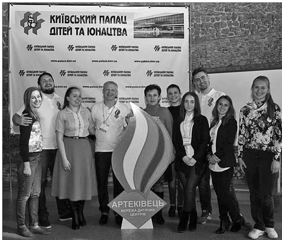
Упродовж двох днів у столичному Палаці дітей та юнацтва тривав перший Фестиваль дитячого відпочинку і туризму KidsCampFest

Анастасія ШАПОРЕНКО, Альбіна КОСОЛАПЕНКО, ІТА «ЮН-ПРЕС» | спеціально для «Хрещатика»