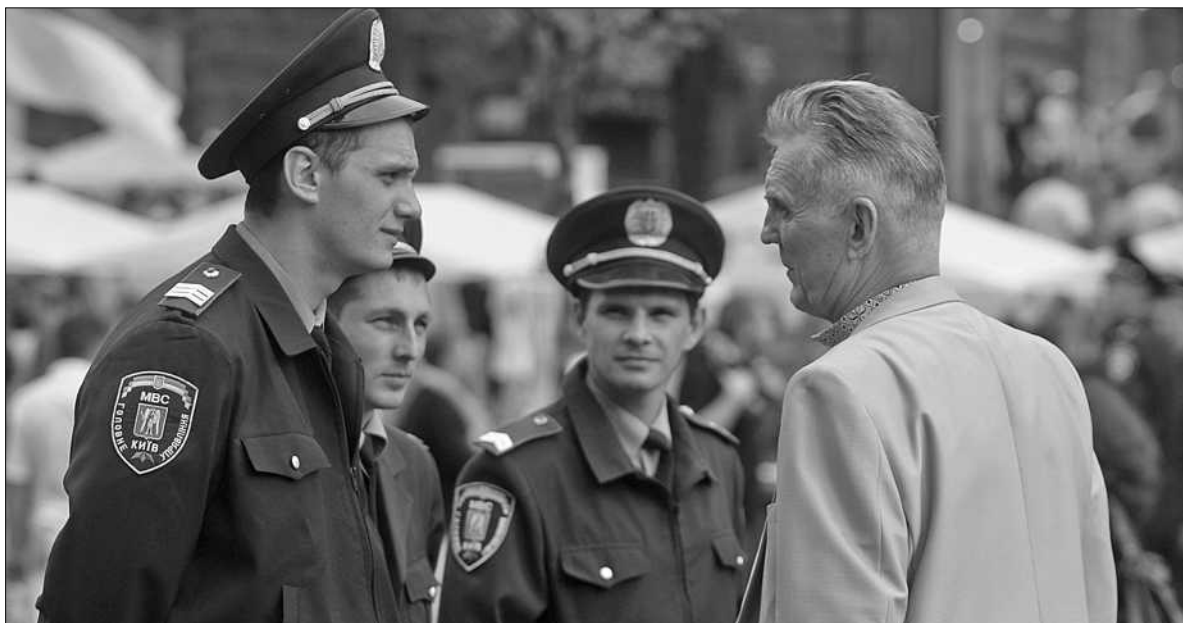
Місця скупчення людей у столиці перебувають під особливою увагою МВС

■ Охоронятимуть спокій в столиці на травневі свята додатково ще 3 тисячі міліціонерів