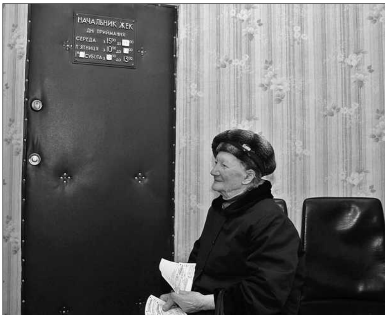
У місті було проведено акцію «таємний покупець», де під виглядом звичайних споживачів до ЖЕКів ходили перевіряльщики

■ В КМДА прозвітували про хід удосконалення управління ЖКГ