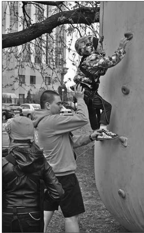
На юних учасників заходу чекали цікаві квести від MAP та випробування від скаутів, Великий скеледром, Козацькі забави та Бойовий гопак, виставка фотографій, флеш-моб, малюнки на піску