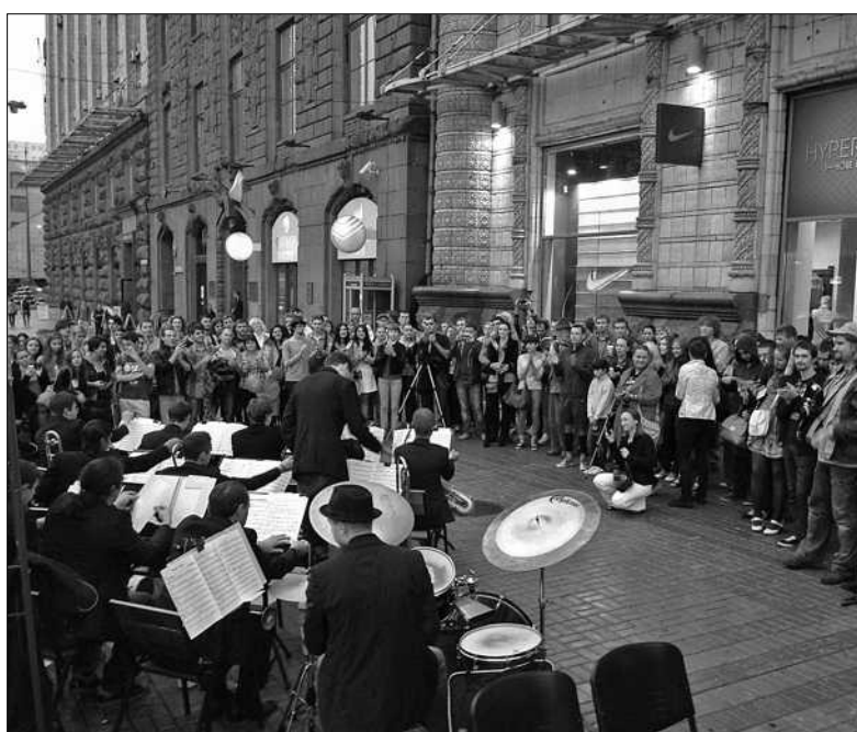
Прикладом спільного публічного простору в Києві були концерти усіх бажаних, які проходили 2013 року на Хрещатику поруч з Департаментом містобудування і архітектури

Вартість квитків: 20 грн, пільговий — 10 грн