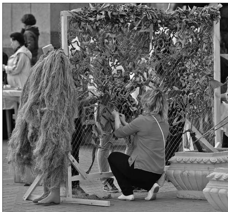
Під час майстер-класів усі охочі мали нагоду взяти участь у виготовленні ляльок-мотанок чи в плетінні маскувальних сіток і костюмів «кікімор» для наших розвідників у зоні АТО

Щоб ефективніше вирішувати питання погашення боргів, місто планує створити Єдине комунальне об'єднання. Реорганізація дасть змогу скоротити організаційні витрати — сьогодні на одного робітника припадає іноді по два керівника. До речі, до керівників посилена увага. Було проведено акцію «таємний покупець». Під виглядом звичайних споживачів до ЖЕКів ходили перевіряльщики. Там їх втримували в багатогодинних чергах, грубіянили. В результаті акції звільнено 4 очільників ЖЕО. Загалом з осені минулого року роботи позбулися 14 недобросовісних керівників ■