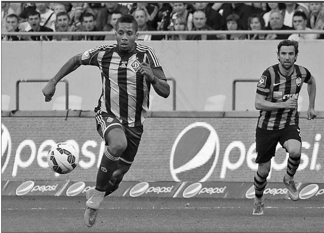
Завдяки нічийному результату «Динамо» зберегло перевагу над «Шахтарем» у 5 очок

Перший удар у грі завдав Ракицький, уже на третій хвилині. Він пробив здалеку, проте неточно. Взагалі команди розпо-