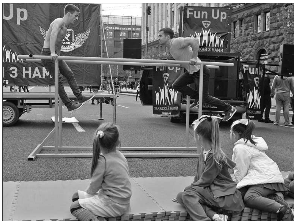
Виступи спортсменів з колективу «Street workout» надихнули учасників FunUp до активного відпочинку