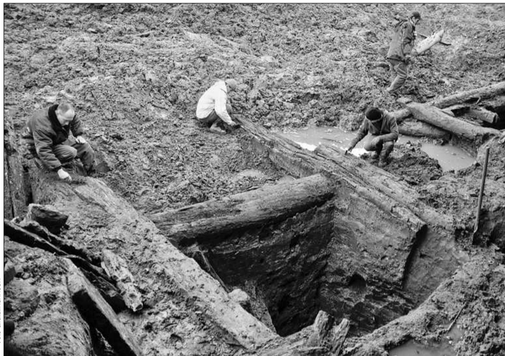
Знайдені на Поштової площі археологічні артефакти мають бути збережені та музеєфіковані