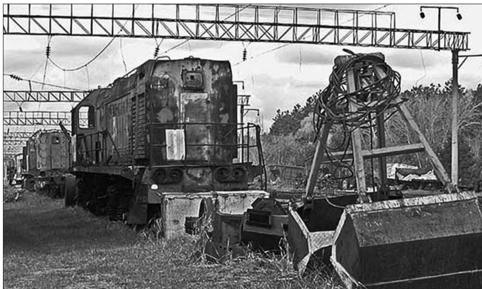
Наразі Прип'ять може послужити всім нам, а не тільки здобувачам металобрухту

Сьогодні місто повністю покрите зеленим килимом рослинності, території житлових кварталів, залишившись без нагляду людини, почали швидко заростати чагарниками і деревами. Будинки ніби «захоплюються» ажурним пледом з дикого винограду і плюща. Стадіон, дитячі майданчики і тротуари вже зникли під рослинними килимами. Поступово заповнюються молодими деревцями і дороги всередині міста. Деякі вулиці вже нагадують тунелі — зелені гіганти, які виростили на узбіччях, зімкнули над магістралями свої крони. Мине час — і територія міста стане цілним зеленим острівом, з якого, як неприступні скелі, ще довго будуть визирати світлі обриси багатоповерхових будинків міста-примари ■