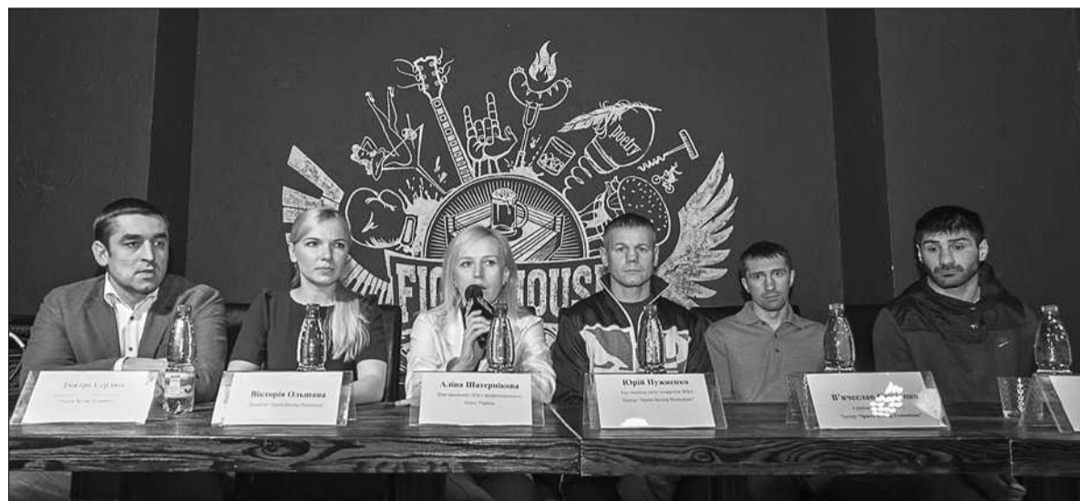
Організатори турніру «Super 8» під час презентації змагань

Перший турнір проведуть у ваговій категорії до 69 кг. Відбір боксерів проходив по всій Україні протягом останніх двох місяців, і тепер з кількох десятків кандидатів після спарингів і тестувань відібрали вісімку, яку представлять у найближчу п'ятницю, 24 квітня, під час церемонії зважування. Поєдинки обіцяють бути дуже цікавими, адже до цього спортсмени ніколи не зустрічалися між собою у спарингах. До того ж і винагорода переможцю буде більш ніж гідною. Найкра-