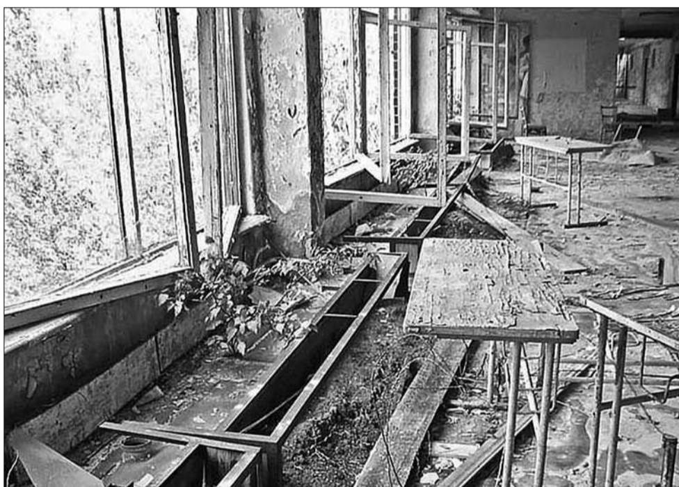
Сьогодні місто Прип'ять остаточно покинуте людьми. Будинки і споруди вже вступили в стадію необоротної деградації

вався автопарк — наприклад, поливні машини з нього 3—4 рази на день заливали водою дороги й узбіччя навколо Чорнобильської АЕС і в самій Прип'яті. До 1999 року діяв завод «Електрон», де випускали роботи й автоматизовані системи для роботи в складних радіаційних умовах всередині «Саркофагу». Конструктори винаходили механічні «руки», які замість людських рук повинні були б витягти залишки ядерного реактора і захоронити їх глибоко під землею. Деякі унікальні агрегати, залишившись беззахайними, і зараз знаходяться в розграбованих цехах заводу.